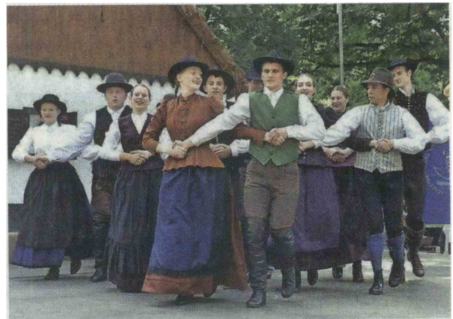
V Beltincih so nastopili tudi člani FS Ozara Kranj.