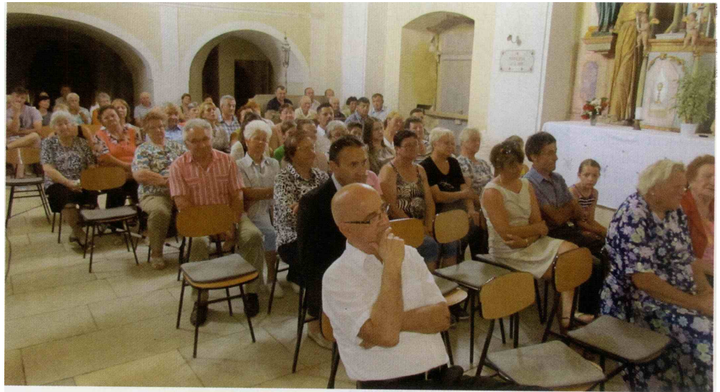
V cerkvi so številni obiskovalci uživali ob lepih pesmi.