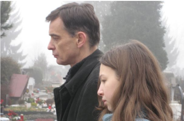
Every Breath You Take (r. Igor Šterk)

Na različnih prizoriščih v Ljubljani (Slovenska kinoteka, Muzejska ploščad Metelkova, KULT3000 , Tovarna Rog, Hostel Tresor) bo med 24. in 28. avgustom potekal 1. mednarodni festival kratkih Kraken (FeKK) , ki bo predstavil kvalitetno kratkometražno produkcijo domačih in tujih avtorjev. Festival organizira Društvo za uveljavljanje kratkega filma Kraken, katerega cilj je kratko formo v javnem diskurzu enakovredno postaviti ob bok celovečerni ter ustvariti stičišče avtorjev, teoretikov, producentov in festivalskih organizatorjev. Projekcije bo spremljal bogat spremljevalni program z okroglimi mizami z domačimi in tujimi filmskimi strokovnjaki, delavnicami, kritičkim natečajem, večernimi druženji in glasbenim programom.