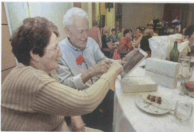
Za 80. rojstni dan so mu poklonili tudi tablični računalnik.