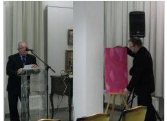
Na sinočnji dobrodelni licitaciji so za otroke iz socialno ogroženih družin zbrali 250 evrov.