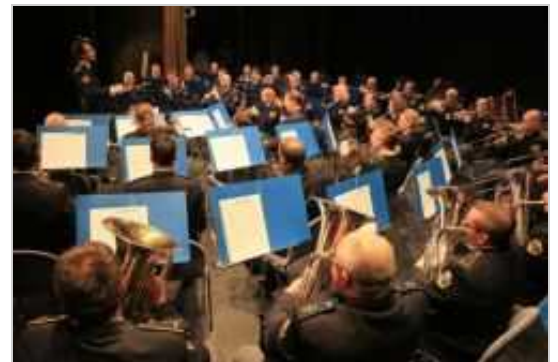
V kulturnem programu je nastopil Orkester slovenske policije.