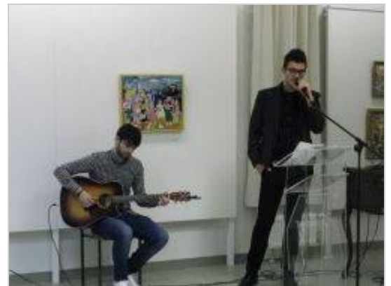
Dobrodelno licitacijo so združili s pestrim kulturnim večerom.