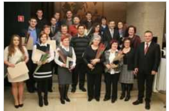
Letošnji nagrajenci ob kulturnem prazniku občine Krško.