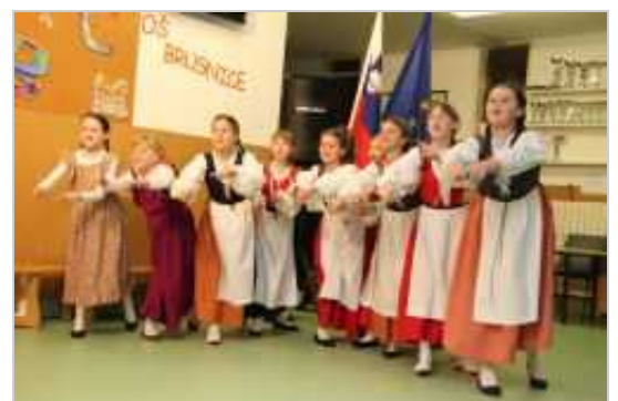
Nastopila je tudi šolska folklorna skupina.