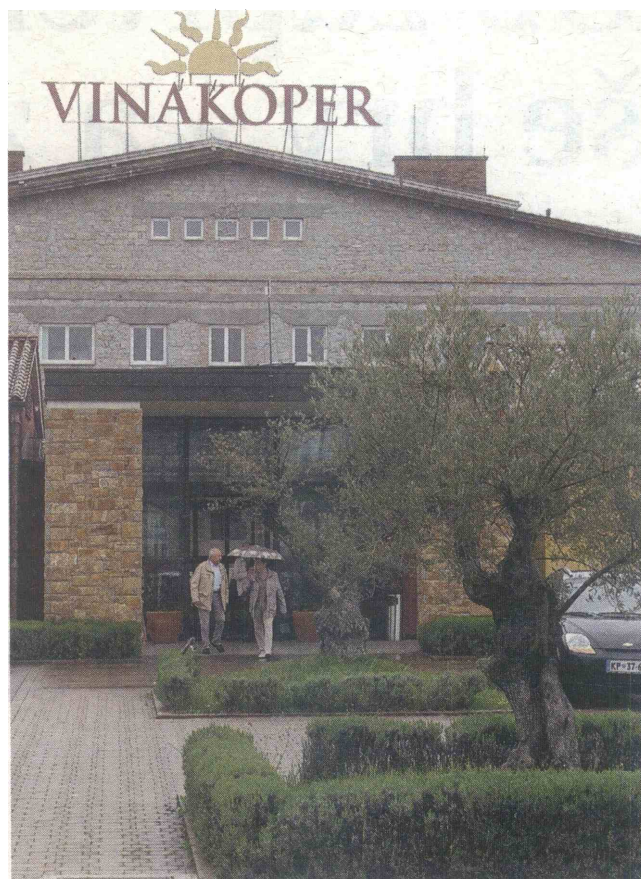
Vinakoper posluje dobro, kljub temu da njegova dva velika lastnika, Luka in Istrabenz, nista na isti valovni dolžini.