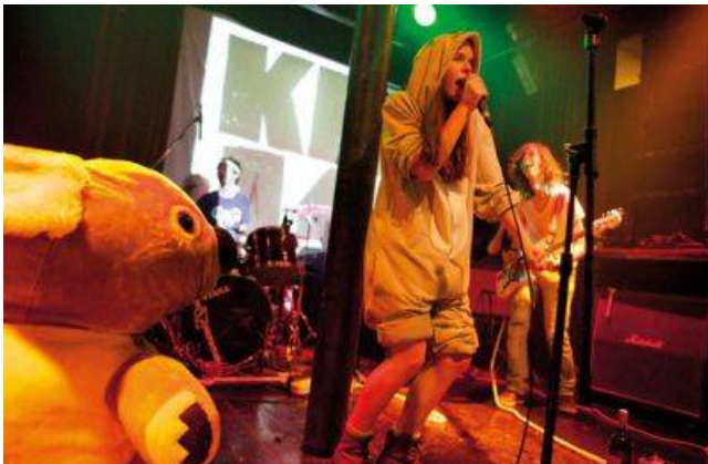
Neobremenjeni in mladostno zagnani Koala Voice

K njihovi vse večji priljubljenosti je gotovo prispevala tudi odločitev slovenskega ponudnika telekomunikacijskih storitev Si.mobil, da komad Go Disco, Go uporabi v oglasu. Od takrat v Sloveniji verjetno ni gospodinjstva, ki ga ne bi primamili preprosti, lahkotni in neobremenjeni ritmi četverice, ki glasbo očitno jemlje za zabavo, a se je hkrati loteva izjemno resno, in kot je opaziti, tudi podjetno.