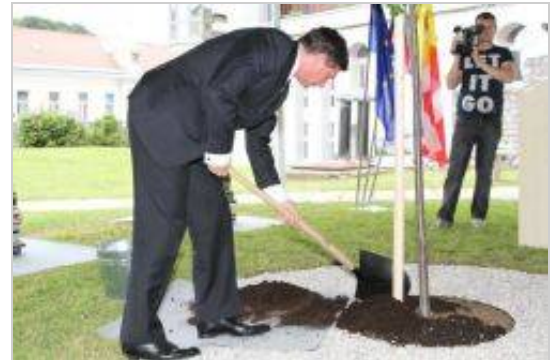
Predsednik države Borut Pahor je v okviru projekta Rastoča knjiga junija 2013 lipo posadil v parku pri knjižnici Mirana Jarca v Novem mestu.

V nadaljevanju željo akcijo razširiti s ciljem, da bi vsak Slovenec posadil eno medovito rastlino in tako izkazal skrb za kranjsko čebelo. Ker je