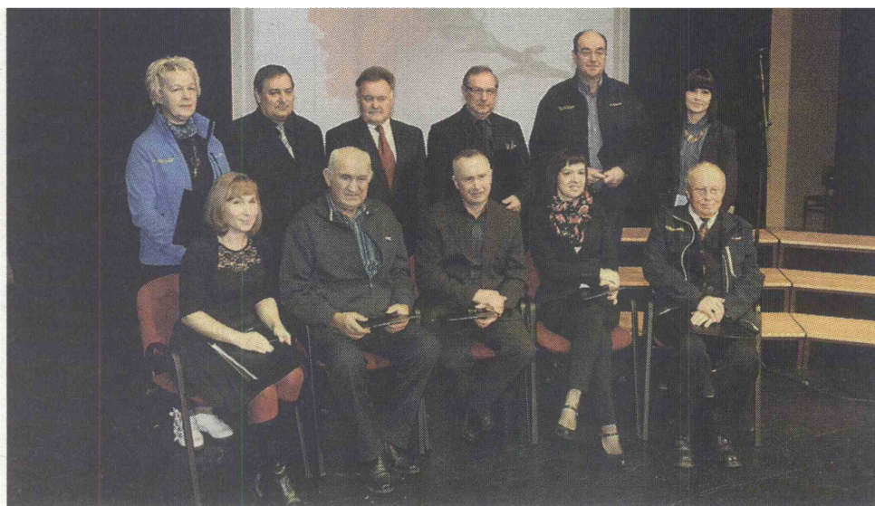
Letošnji dobitniki značk Ksavra Meška na prireditvi v Veliki Nedelji.