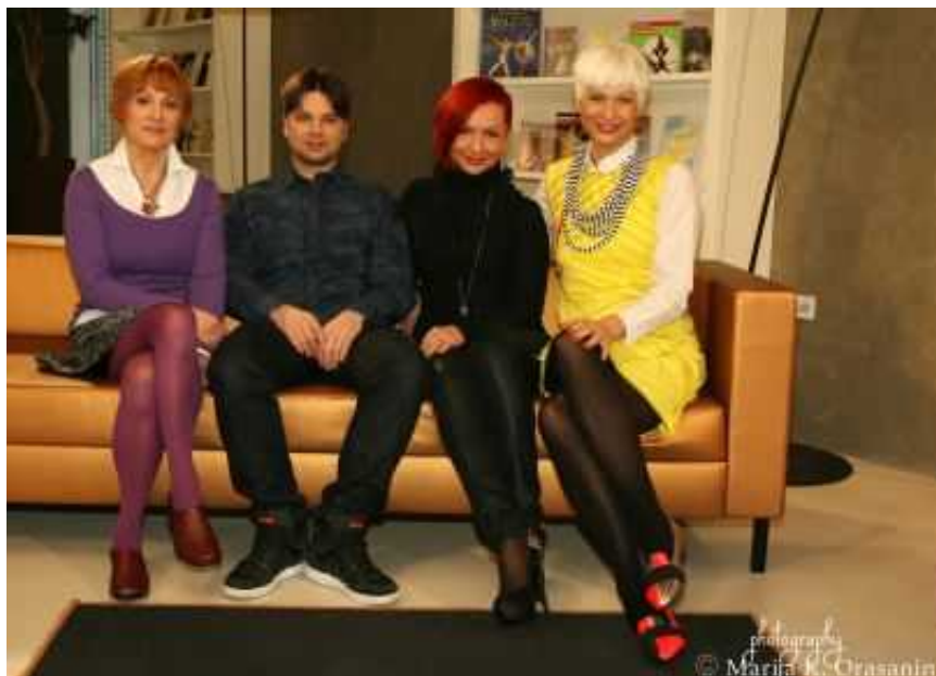
Oddajo Parada plesa smo posneli v ambientu Maxi kluba v Ljubljani.

Oddajo Parada plesa si oglejte danes zvečer ob 21.55 na TV3 Medias tudi zato, ker je dan s plesom odličen dan. Če nas zamudite, pa vas čakajo ponovitve v petek, 27.2., ob 15.30, v soboto, 28.2., ob 15.10 in v torek, 3.3., ob 8.30.