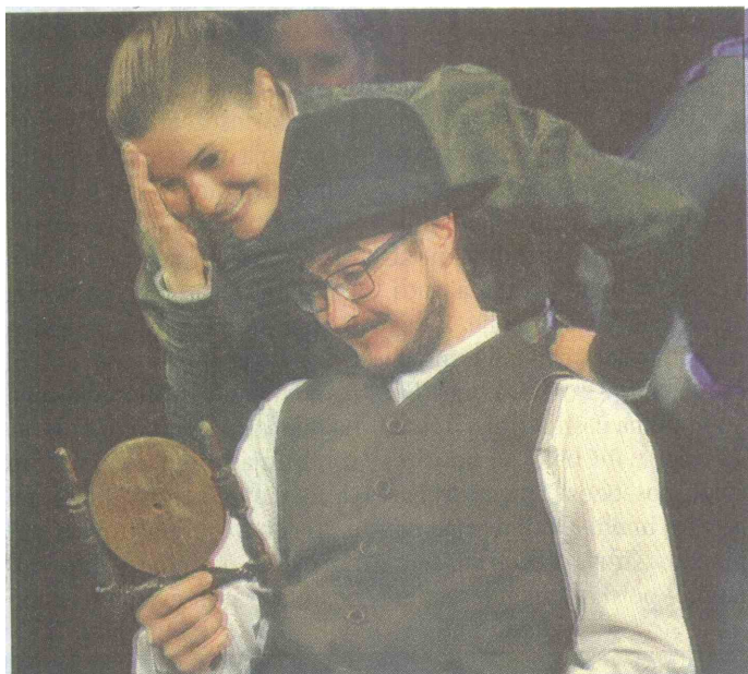
Pri »špegltanzu« oglevalo izbira plesalko.

Mojca Šilc, fotografije: Klemen Farkaš in Mojca Šilc