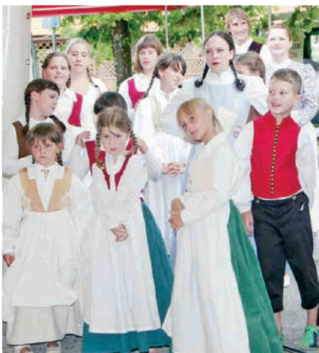
Otroška folklorna skupina Plamen v novi škocjanski noši. Koliko truda se skriva v teh oblačilih!