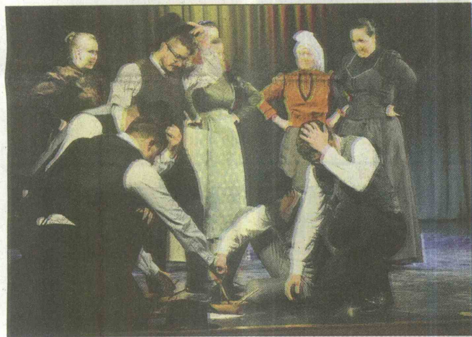
Po košnji se prileže malica.