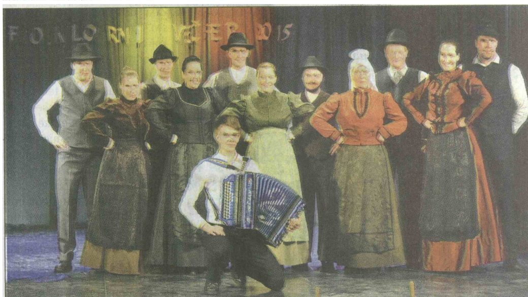
Mladi podeželani v novih folklornih oblačilih