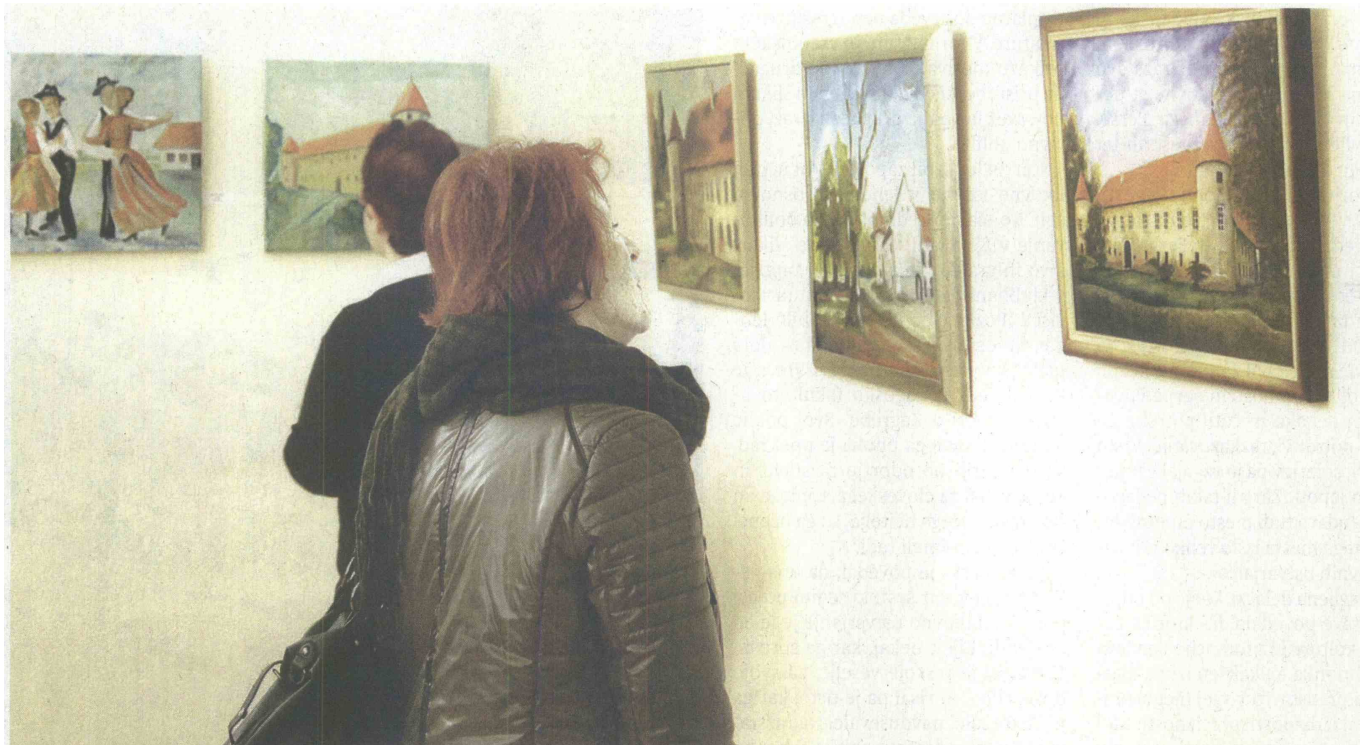
V prostorih beltinskega gradu se predstavlja šestnajst pomurskih ljubiteljskih likovnikov.