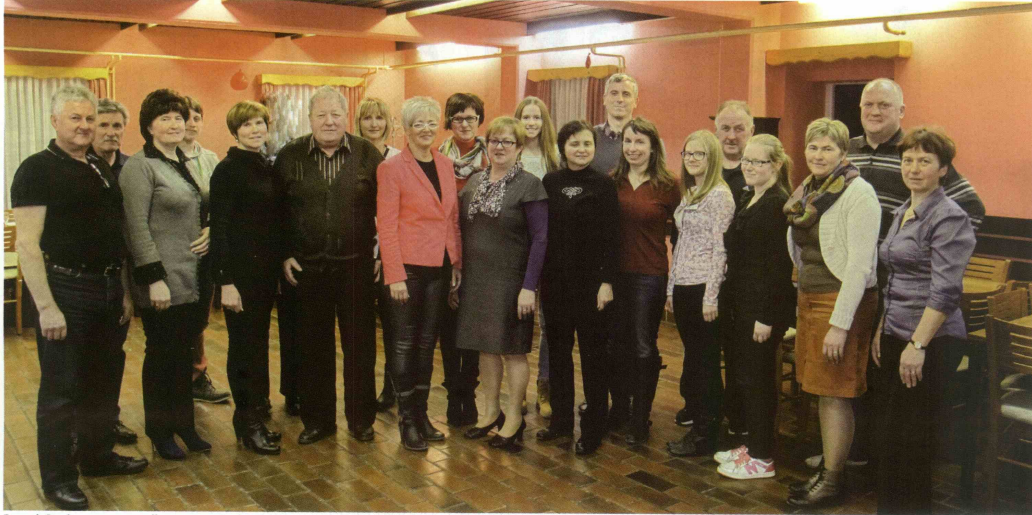
Pevci Cerkvenega mešanega pevskega zbora Zvon Podčetrtek, ki so letni občni zbor izvedli po rednih tedenskih vajah, obljubljajo, da se bodo tudi v letu 2015 trudili razveseljevati zveste poslušalce.

Za pevce Cerkvenega mešanega pevskega zbora Podčetrtek, ki so združeni v Kulturno društvo »Zvon«, je bilo minulo leto zelo dinamično, delovno, uspešno in pevsko naklonjeno. Poleg ustaljenega petja pri svetih mašah, tradicionalnih koncertov v maju in decembru ter ostalih nastopov so lani suvereno nastopili še na Sozvočenjih v Olimju.