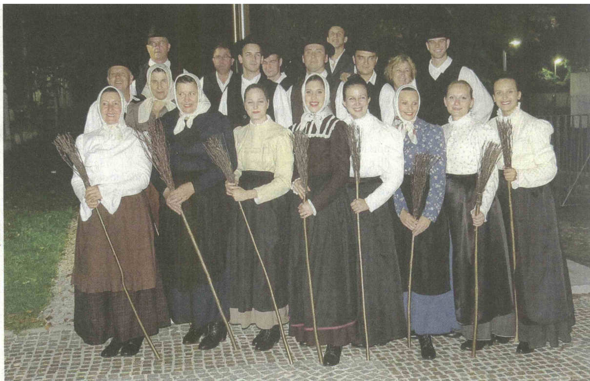
Velikopolanska folklorne skupine pleše prekmurske in porabske plesse.