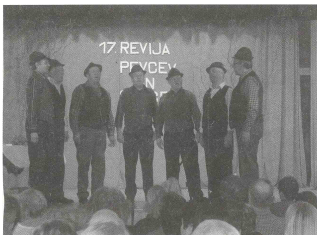
Vaberški fantje iz Kovače vasi KUD Smartno na Pohorju