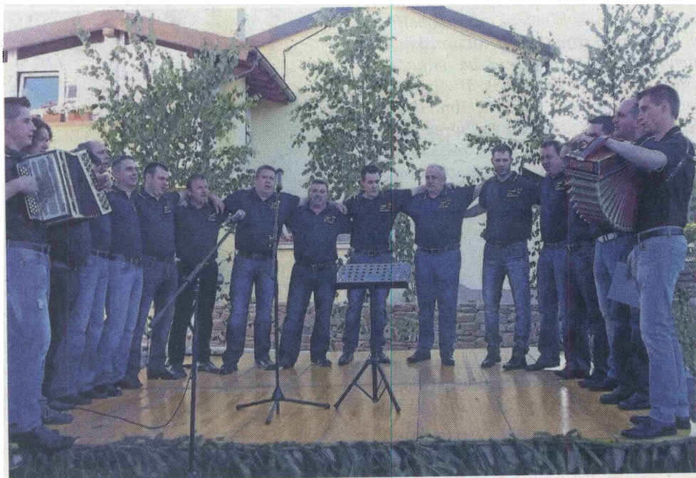
Fantje spod Karlovice so zapeli tudi ob zvokih dveh frajtonaric.