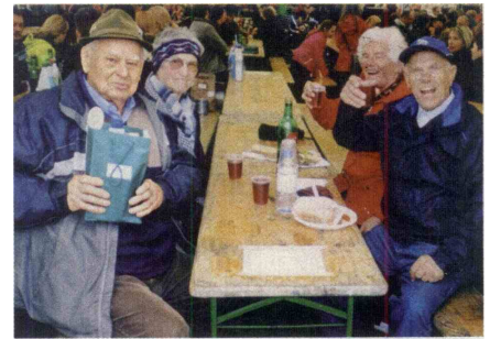
▲ Prvomajski dan je minil v dobri družbi.