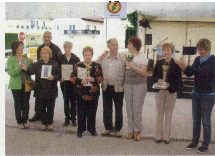
▲ Zmagovalci so vsi.

Dom starejših Videm Dobrepolje, Zavod svete Terezije, ki je bil odprt novembra 2006, je gostil udeležence že 27. srečanja domov Dolenjske in Bele krajine. Stanovalci in zaposleni v domovih iz Novega mesta, Metlike, Črnomlja, Trebnjega, Grosuplja, Ponikev, Dobrepolja, Ribnice in Kočevja so prisluhnili