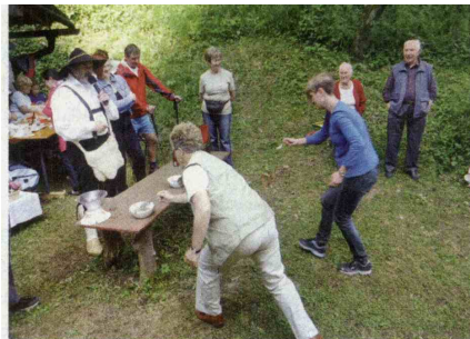
▲ V društvu je vselej pestro.

vikend v maju poklonili na dvodnevni priveditvi Odmevi dediščine 2015. V soboto je društvo odprlo objekte tehniške dediščine. Prikazalo je etnološke filme in postavilo pisano tržnico dediščine, ki je ponudila zabavo vsem generacijam. Sodelovali so ljubitelji starin, narečja, cvetja iz krep papirja in staro-