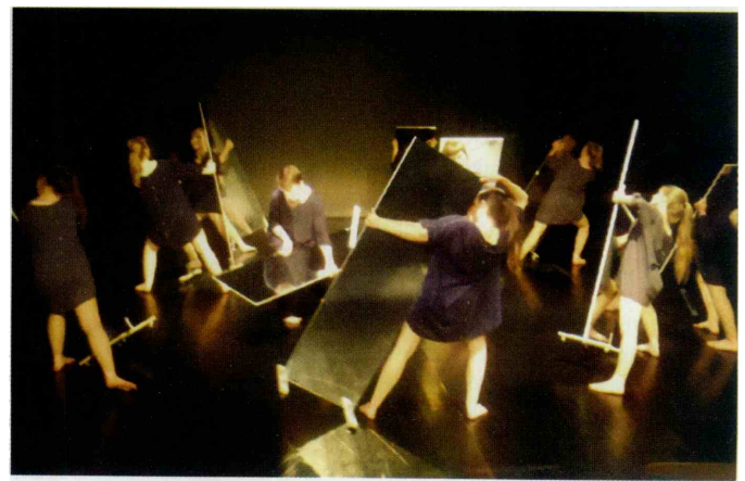
Zrcalce, zrcalce na steni povej, kdo jaz sem v deželi tej?