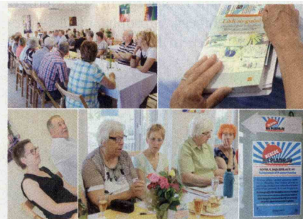
▲ Da naš jezik ne bi utonil v pozabo!