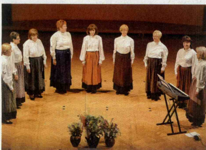
▲ Ob jubileju so Kresnice pripravile raznolik izbor pesmi.

Ob besedi kresnice večina ljudi pomisli na drobne lučke in ne na to, da se tako imenujejo tudi ivanjščice oziroma marjetice. In prav po teh se je poimenovala vokalna skupina devetih predstavnic iz Maribora. Ideja o skupini, ki bi prepevala ljudske pesmi, se je porodila v glavi Metke Potisk in Metke Rav-