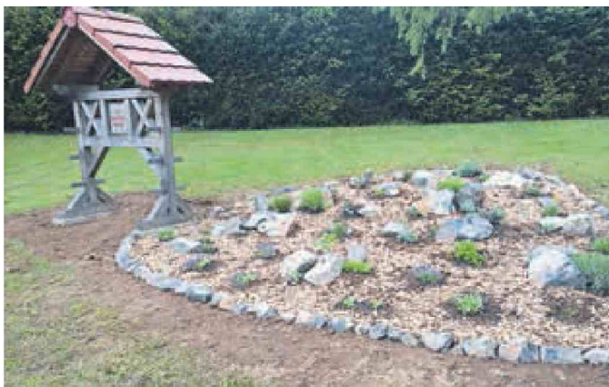
Topličkova učna pot je sestavljena iz različnih učnih postaj z zanimivimi učnimi vsebinami. Ena izmed postaj je tudi zeliščni skalnjak.