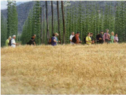
▲ Druženje vseh generacij

Trnava, kjer je bil postanek za prigrizke Društva podeželskih žena Žalec. Tukaj so se lahko odločili za daljšo pot prek Petrovega vrha do jame Pekel. Pred jamo je bilo pestro dogajanje. Taborniki so postavili poligon, otroci pa so skupaj z upokojenci sodelovali v športnih igrah.