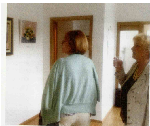
Med ogledom slikarskih del.