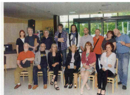
▲ Radenski umetniki pridno ustvarjajo.