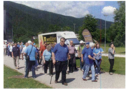
▲ Med razgledom mesta