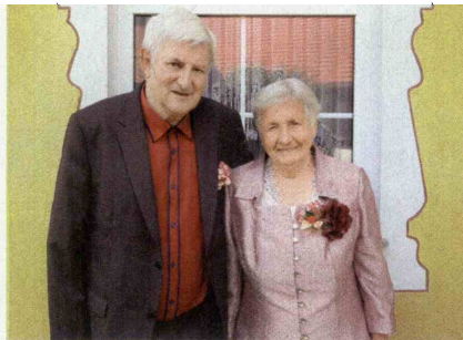
▲ Družina jima je pripravila lepo presenečenje.