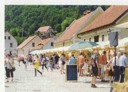
▲ Ponudba je bila raznolika.

V Kozjanskem parku so 7. junija organizirali že 3. Festival ekološke hrane v trgu Podsreda. Na srednjeveškem trgu so se predstavljali ponudniki ekološke hrane iz zavarovanega območja tamkajšnjega parka ter iz njegovega širšega zaledja. Ponudba na 33 stojnicah je bila zelo raznolika: sveže sadje, zelenja-