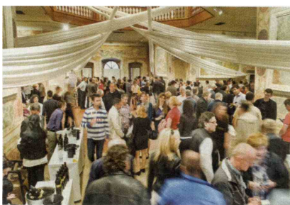
▲ Obiskovalcev ni manjkalo.

Letos je razvojna agencija Rod iz Ajdovščine v sodelovanju z vipavskimi vinarji pripravila že 9. festival vina in kulinarike Okusi Vipavske. Drugi vikend v maju je slikovito okolje renesančnega dvorca Zemono pri Vipavi spet postalo kraj tisočerih okusov, priložnost za ljubitelje izjemnih vin in slastnih kulinarčnih doživetij. To je bil le vrhunec dogajanja, saj so si organizatorji letos zamislili kar cel kulinarčni mesec. Od 17. aprila do 17. maja je namreč dvajset restavracij vzdolž Vipavske doline pripravljalo posebne festivalske menije. V slogu vipavskih dobrot so bile na krožnikih jedi iz domačih pridelkov in izdelkov. Del festivala je vedno namenjen spajanju hrane z vinom in tudi v mesecu kulinarčnih doživetij je bilo enako. Ob hrani so obiskovalci lahko okušali vipavska vina, ki so jih domači vinarji predstavili na letošnjem festivalu. Med udeleženci festivala je vsako leto več mladih. Da bi jim dogajanje še bolj približali, so organizatorji pripravili dogodke v dveh slovenskih mladinskih centrih, v Cerknem 11. aprila in v Celju 18. aprila.