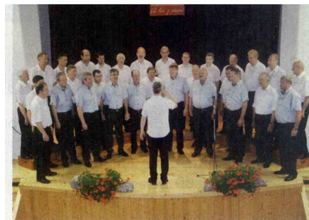
▲ Zapeli so na ves glas!