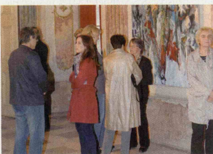
▼ Razstava je na ogled do konca avgusta.