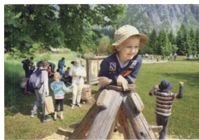
»U konc' sveta so pravljičice doma«.

Otroški pravljичni vikend, dogodki v okviru znamenovanja 100. obletnice začetka soške fronte, bogat nabor delavnic in kulturnih prireditev, kulinarčni večeri in vsakodnevni vodeni botanični izleti – vse to prinaša Mednarodni festival alpskega cvetja, ki v Bohinju poteka vsako leto od konca maja do