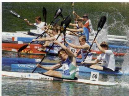
▲ Prve dni julija vabljeni v Bohinj!

Od 1. do 5. julija poteka na Bohinjskem jezeru evropsko prvenstvo v kajakaškem maratonu in tekme veteranov z vsega sveta. Prvenstvo pritegne v Bohinj več kot tisoč tekmovalcev, spremljevalcev, navijačev in obiskovalcev ter promovira Bohinj in Slovenijo kot idealen kraj za športne počitnice. V Sloveniji se je takšen maraton začel razvijati pred nekaj več kot petimi leti.