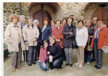
▲ Spet so se družile.

V Gornji Radgoni so se konec maja, po 65 letih, kar so zapustile šolske klopi, srečale dijakinje prve generacije Srednje medicinske šole Ljubljana. V dveh razredih je takrat, med letoma 1947 in 1950, šolo obiskovalo 54 dijakinj, ki so se rodile leta 1932. Srečanje so popestrile z obiskom šampanjske in skalne kleti podjetja Radgonske gorice v Gornji Rad-