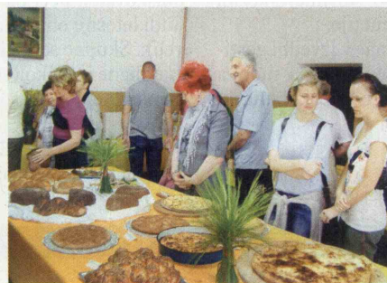
▲ Imeli so kaj pokušati.

V sklopu 16. praznika občine Veržej so v prostorih vaškega gasilskega doma v Banovcih odprli razstavo Dobrote naših gospodinj. Kulinarično razstavo vsako leto pripravlja druga vas v občini, letos je ta čast pripadla Turističnemu društvu Banovci. Nastalo je več kot sto vrst različnega peciva, tort, potic, krofov in izdelkov iz krušnega testa v obliki cvetov, na mizo so postavili tudi pravo prleško tunko. V krušni peči je dišalo po domačem črnem in belem kruhu, pletenicah, sadnem kruhu, krapih, kvasenih, postržnjačah, že-