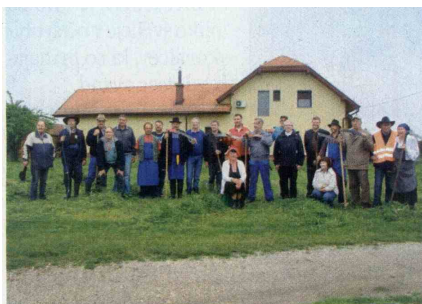
▲ Sredi Beltincev so kosili z ročnimi kosami.