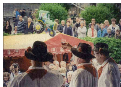
▲ Vreme ni ustavilo vigredi.

Letos je mokra Zofka dobro uresničila svoj sloves in namakala dva dni. Če ne bi prireditev 33. Vinska vigred trajala tri dni, sonca na nebu ne bi niti videli, je bilo pa toliko svetleje v očeh obiskovalcev, ki so prihajali od vsepovsod. V prireditvenemu odboru ugotavljajo, da je tudi letošnja Vinska vigred uspela. Obisk je bil nekoliko manjši, predvsem na račun dnevnih obiskovalcev, medtem ko je bil večerni zabavni program dobro obiskan. V treh dneh je na treh metliških placih obiskalo prireditev več kot 17.000 ljudi. Ves trud, ki so ga organizatorji vložili v organizacijo in usklajitev programa, je bil povrnjen, tako so zadovoljni ne le z izkupičkom, pač pa tudi s celotnim odzivom sodelujočih na prireditvi. Na letošnji vigredi so v večernih urah prevladovali mladi obiskovalci, sicer pa tudi starejše populacije ni manjkalo.