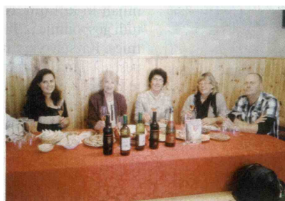
▲ Del organizacijskega odbora

Že 11. prireditev V osrčju dežele terana so zadnji dan maja pripravili v petih vaseh KS Tomaj. Letos je na prireditvi sodelovalo enajst vinarjev in sिरar. Namen prireditve je promovirati kraški teran in beli avtohtoni sorti, vitovsko in malvazijo, ter kulinariko Krasa.