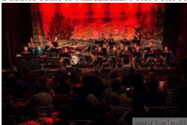
Roveri Big Band se je festivalu poklonil s skladbo Ah Boh.