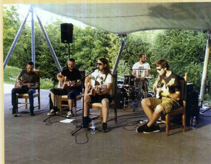
Rock je navdušil Šentjurčane.