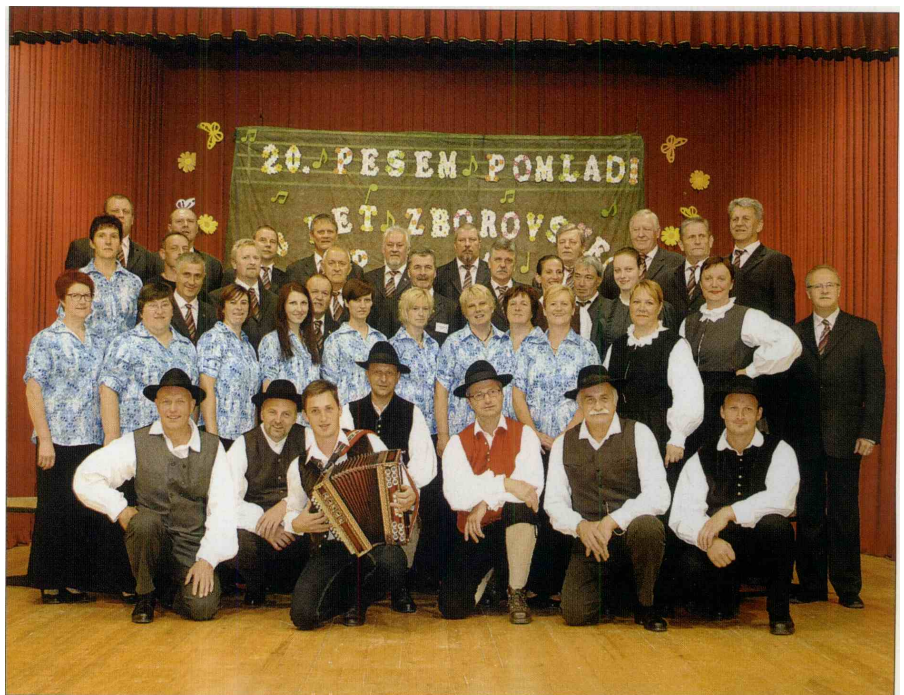
Oba bočka zbora in folkloristi plesalci so z nastopom počastili dolgo zgodovino prepevanja v kraju.