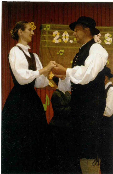
Domači folkloristi plesalci so zaplesali ob pesmi V Savinjskem gaju, ki jo je prepeval domači ženski zbor.

rovodje, ki so skrbeli za ubrano petje vsa ta leta, ter Mitjo Venišnika, ki je bil pobudnik, da se je leta 1995 rodila Pesem pomladi.