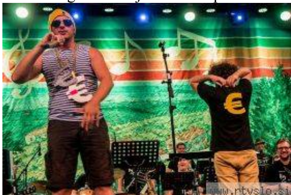
Z Big Bandom Grosuplje je nastopil tudi Smaal Tokk.