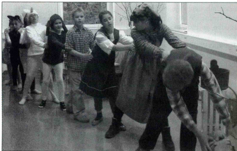
REPA VELIKANKA - Člani lutkovno - gledališkega krožka OŠ Idrija.