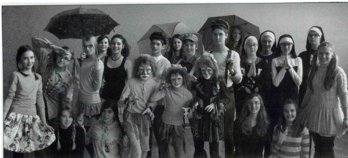
LETOS NA PUSTNI TOREK JE BILO ŠE POSEBEJ VESELO