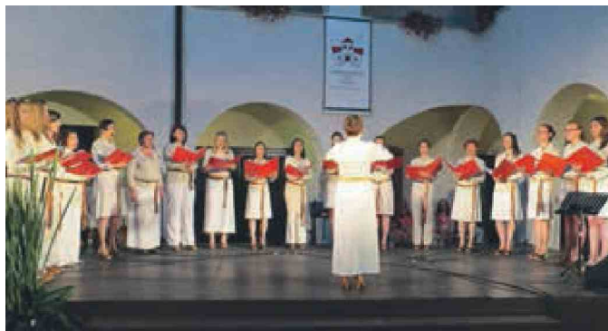
Z dvournega koncerta lanovk na metliškem grajskem dvorišču nihče ni odšel ravnodušen.