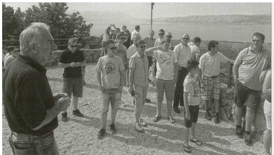
Godbeniki so si ogledali tudi del turistične ponudbe kraja Novi Vinodolski.