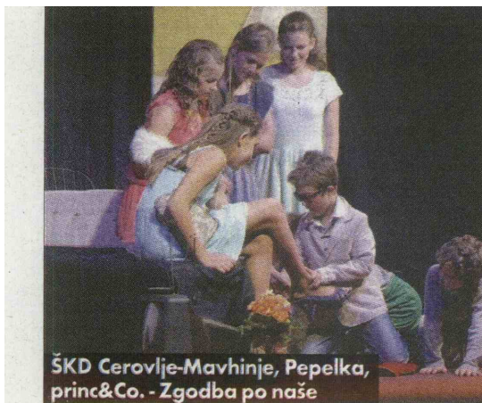
ŠKD Cerovlje-Mavhinje, Pepelka, princ&Co. - Zgodba po naše