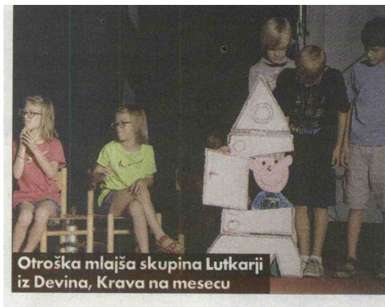
Otroška mlajša skupina Lutkarji iz Devina, Krava na mesecu