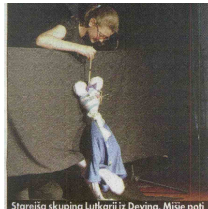
Starejša skupina Lutkarji iz Devina, Mišje poti