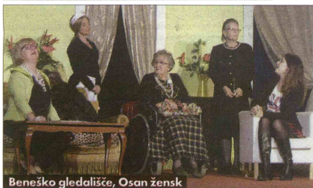
Beneško gledališče, Osan žensk