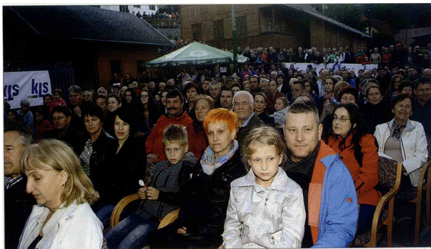
Igrišče pri osnovni šoli v Lučah po besedah poznavalcev ni bilo še nikoli tako do zadnjega kotička polno.