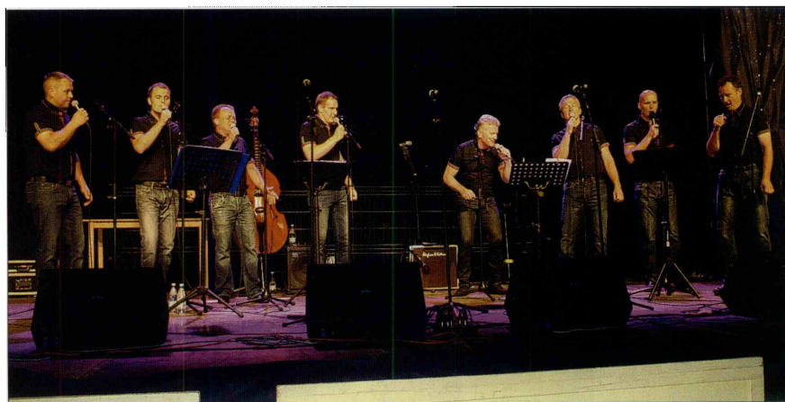
Člani okteta Žetev so ob petletnici v sodelovanju z občino in KD Raduha Luče pripravili odmevno glasbeno prireditev Kresna noč.

Za začetek se je visoko nad prizoriščem oglasila Zdravljica, saj so se fantje povzpeli na plato na šolski strehi. Nato so se pevci premaknili na oder in glasbeni sladkusi so lahko uživali ob slovenski umetni in domači pesmi, ob