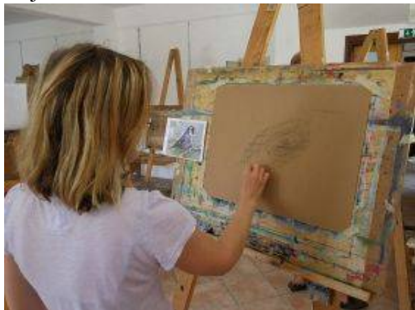
Sinji vrh