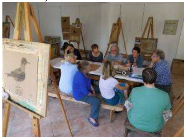
Program likovne delavnice zahteva poseben pristop mentorja in večjo odprtost udeležencev, samoiniciativnost in sodelovanje pri razvijanju programa v okviru izbrane teme.