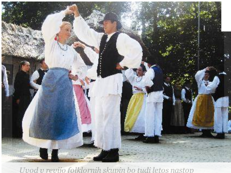
Uvod v revijo folklornih skupin bo tudi letos nastop beltinskih folkloristikov. (Nataša Gider)

pridejo v Beltince folklorni plesalci iz Mehike; beltinski park običajno obišče okrog 10 tisoč ljudi