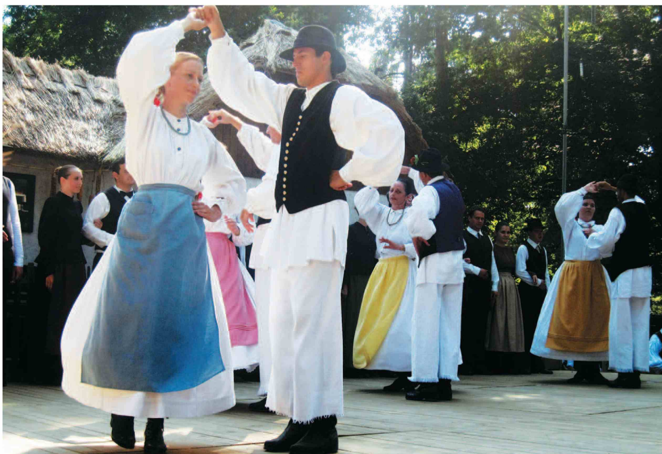
Uvod v revijo folklornih skupin bo tudi letos nastop beltinskih folklornikov. (Nataša Gider)