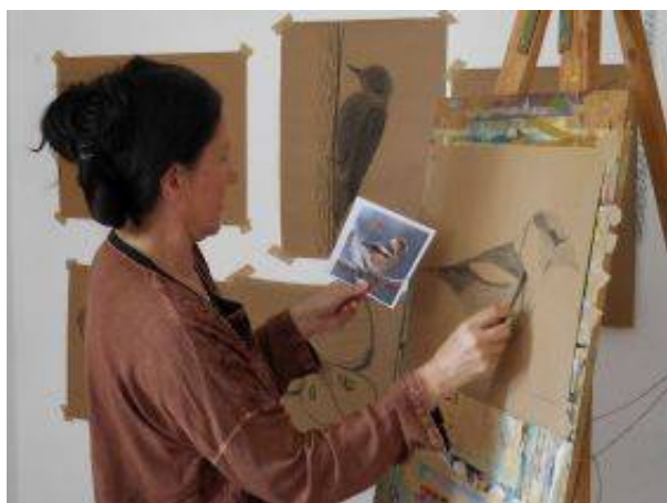
Sinji vrh

Z odzivom na razpisane teme poletnih likovnih delavnic so organizatorji zadovoljni. Nekateri se vračajo več let zapored, vse delavnice pa imajo zelo dolgo tradicijo. Na Sinji Vrh pri Ajdovščini se vračajo 16 let, sicer pa ima julijska delavnica tridesetletno tradicijo. Kiparsko delavnico organizirajo od leta 1997, v Šmartnem ob Paki pa bo potekala že 29. leto.