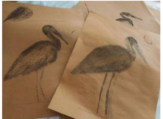
Vsako leto razpišejo drugo temo, letos so ustvarjali na temo živali.

Avgusta pripravlja Javni sklad za kulturne dejavnosti (JSKD) še dve likovni delavnici z dolgoletno tradicijo.