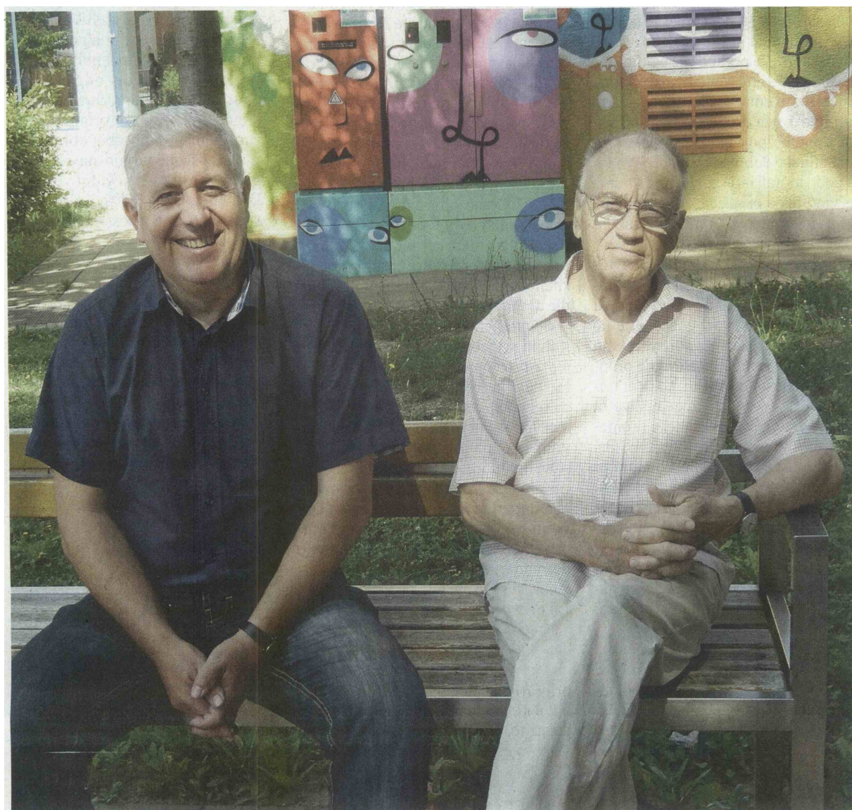
Zborovodja in predsednik MoPZ Društva vinogradnikov Goričko