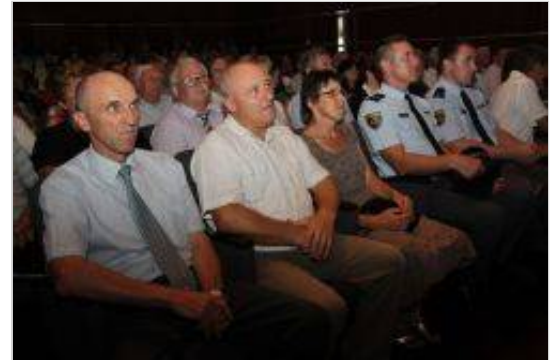
Ostali občinski nagrajenci.