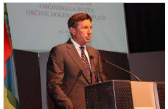
Slavnostni govornik je bil predsednik Borut Pahor.