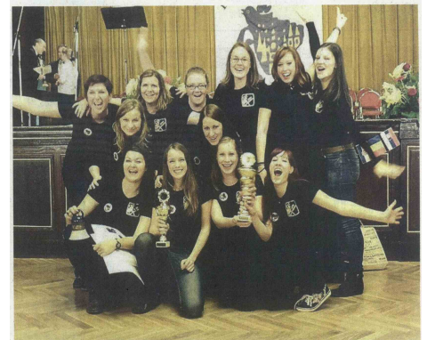
V soboto bodo pri beltinskem gradu na etnovečer nastopile tudi Belo Tinke.

Napovedi kulturnih, turističnih in drugih dogodkov pošiljajte do ponedeljka do 11.00 na elektronski naslov: joze.gabor@vestnik.si .