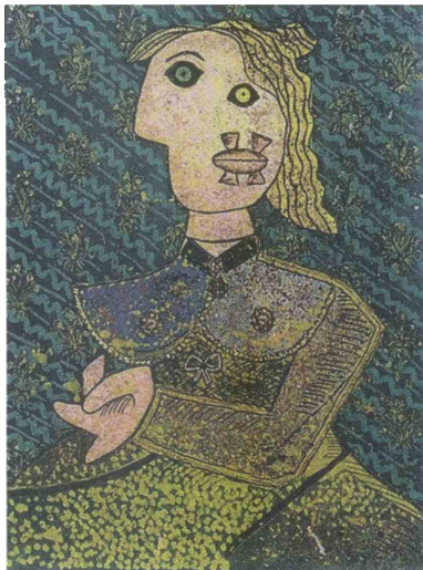
Na lendavskem gradu je na ogled likovna razstava Hommage a Picasso.

V ateljeju v Glavni ulici je na ogled razstava umetniških del 20. mednaro-