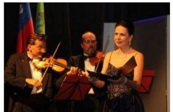
Koncert zasedbe Concilium musicum Wien ob 800-letnici prve pisne omembe Dolenjskih Toplic.