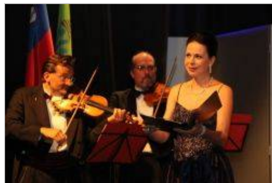
Koncert zasedbe Concilium musicum Wien ob 800-letnici prve pisne omembe Dolenjskih Toplic.