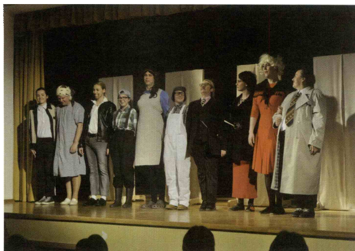
Vseh deset nastopajočih v Rogonoscu: kdo so moški in kdo ženske