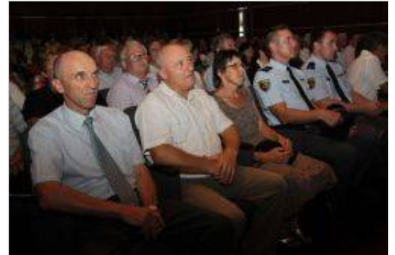
Ostali občinski nagrajenci.