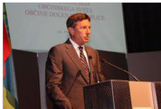
Slavnostni govornik je bil predsednik Borut Pahor.