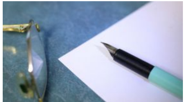
Nagrada bo uglasbitev pesmi in njena predstavitev na Festivalu mlade literature Urška 16. oktobra v Slovenj Gradcu.