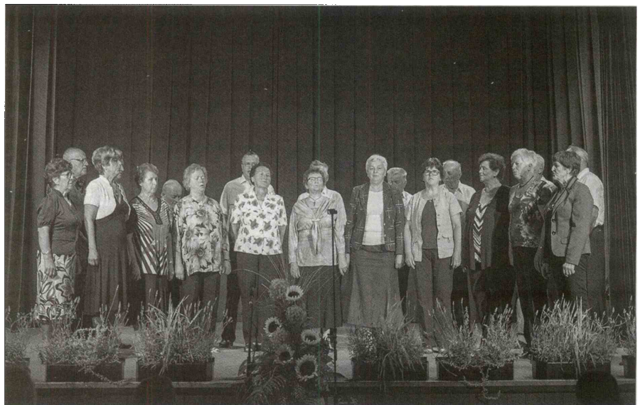
Nastopajoči so obiskovalce popeljali v čas podoknic in čas prepevanja ob najrazličnejših priložnostih.