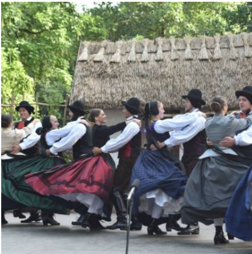
... Folklorna skupina KUD Študent Maribor ...

V nedeljo, 26. 7. 2015, se je v Beltinskem parku trlo ljudi. Razlog je bila prireditev Le plesat me pelji , ki jo je v okviru 45. mednarodnega folklornega festivala v Beltincih na velikem odru pod krošnjami Beltinskega parka pripravil Javni sklad RS za kulturne dejavnosti (JSKD) . Na njej se je predstavil prvi del najboljših folklornih skupin Slovenije. Drugi del srečanja bo potekal 17. oktobra 2015 v Kosovelovem domu v Sežani.