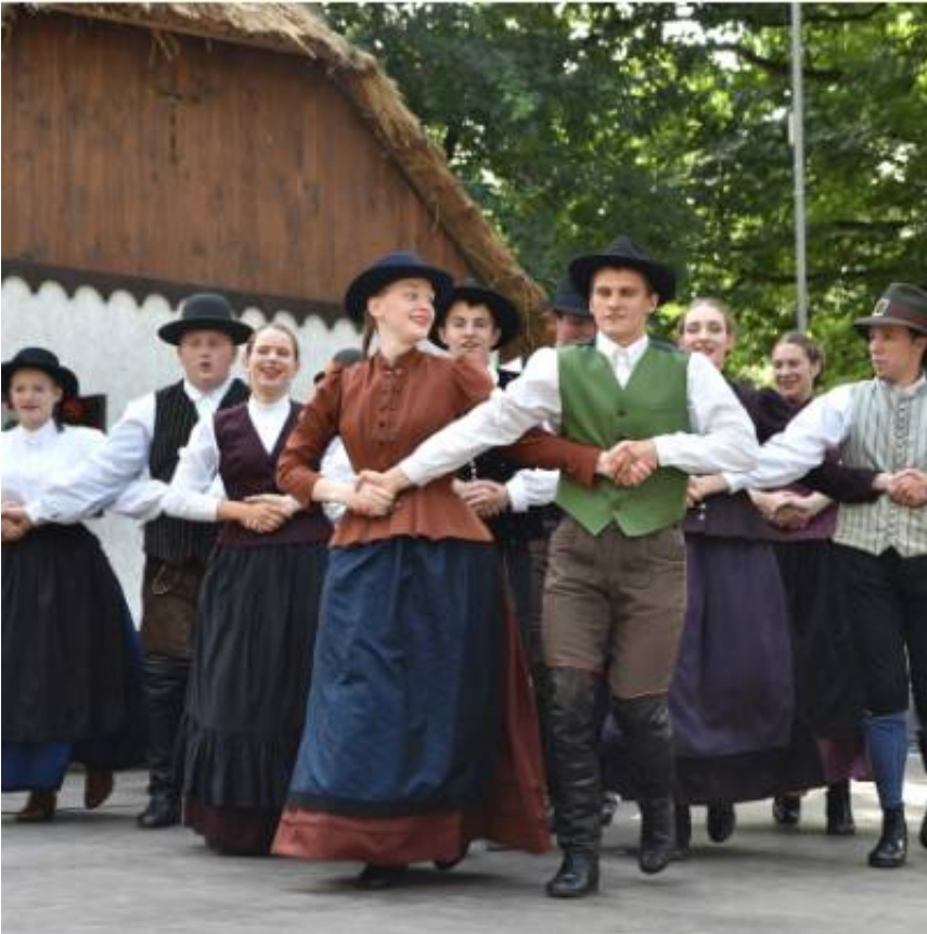
... Folklorna skupina Ozara Kranj ...