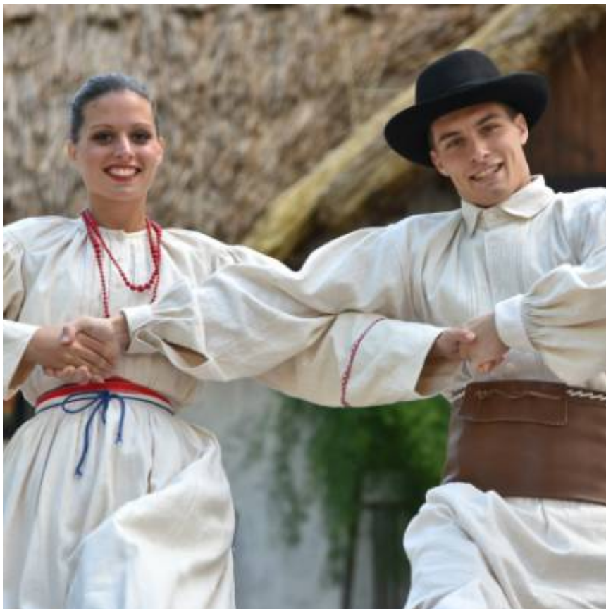
... Folklorna skupina Vinica ...

Na prireditvi Le plesat me pelji se je predstavil prvi del naiboliših folklornih skupin Slovenije