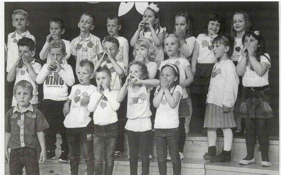
Pevci z Rečice ob Savinji, ki slišijo na ime Lipa, so tudi nosili lipove liste.