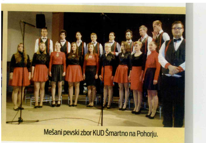
Mešani pevski zbor KUD Šmartno na Pohorju.