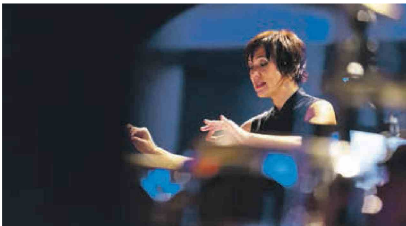
Letni koncert MePZ Viva - Preproste ljubezni, Terme Čatež, oktober 2014