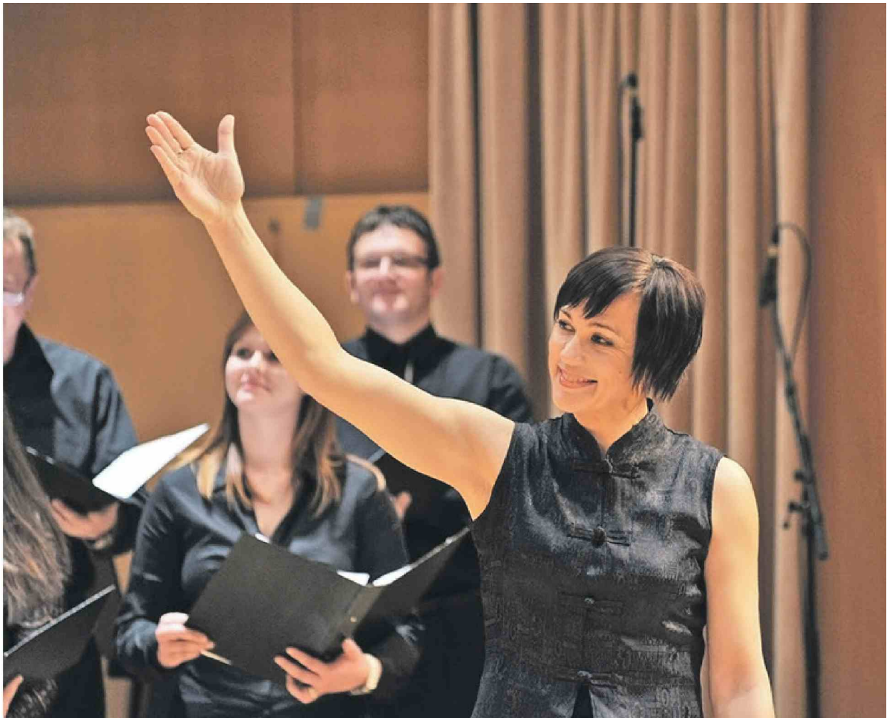
Slovenska filharmonija, december 2014