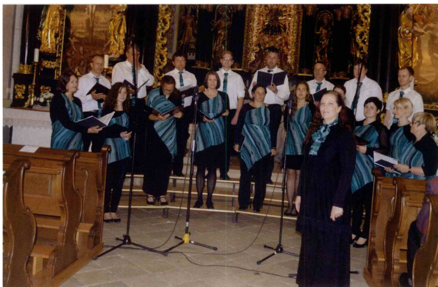
Mešani pevski zbor Bistrica ob Sotli.

Na srečanju so nastopili cerkvena mešana zbora Zvon Podčetrtek in Šentvid pri Grobelnem, moški zbori Kozje, Šentvid pri Grobelnem in Terme Olimia, mešana zbora Vinea Kozje in Bistrica ob Sotli ter obrtniški moški zbor Šmarje pri Jelšah. (A. S.)