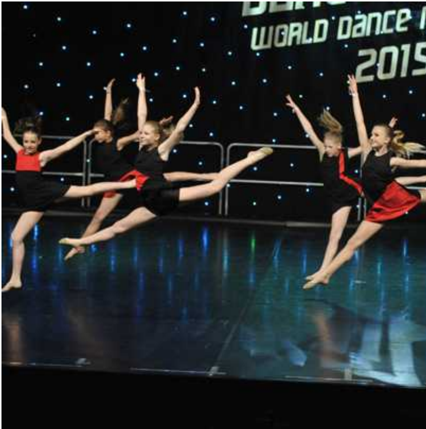
... plesalke Harlekina ...