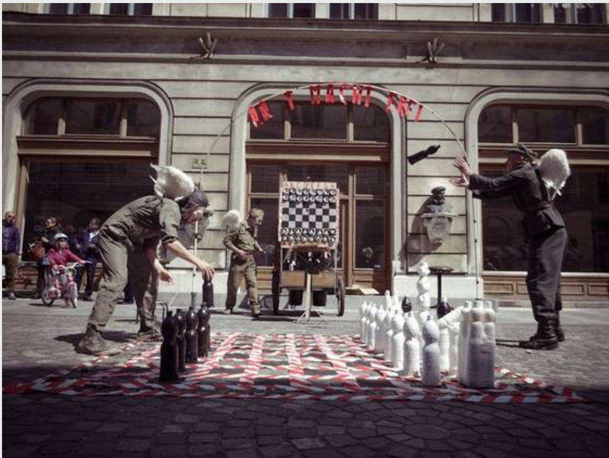
Koprodukcijska predstava Končnica Zavoda Bufeto in Kud Ljud.

Ključne besede: Klovnbuf , festival , Zavod Bufeto , Kud Ljud , Ljubljana