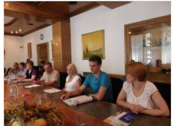
V Trebnjem so danes predstavili sklop prireditev, ki se bodo zvrstile v prihodnjih dneh.

V soboto tukajšnje turistično društvo pripravlja 27. prireditev »Iz trebanjskega koša«, ki jo bodo tradicionalno ob 18. uri otvorili z društveno povorko, v kateri se je lani predstavilo okrog 600 udeležencev. Podelili bodo Trebanjske koše,