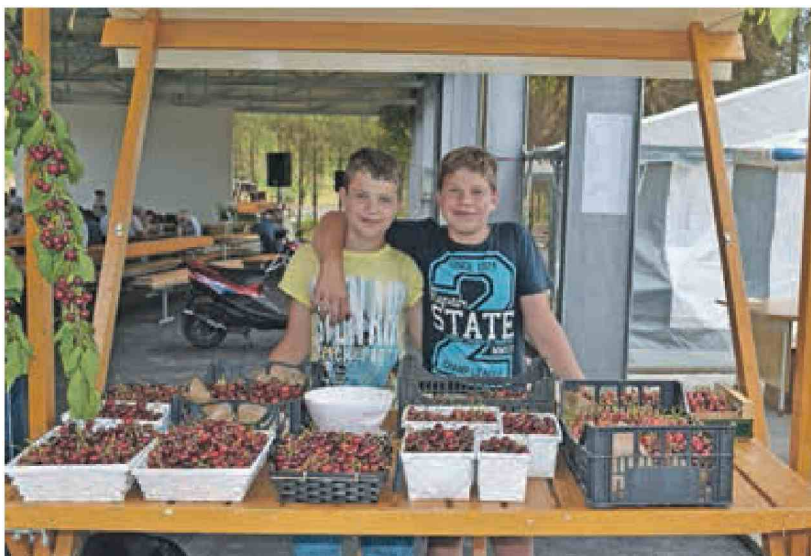
Domačini so tokrat prodali okoli 1.500 kilogramov brusniške hrustavke. Sadike zdaj zaščitene češnje lahko od jeseni dalje kupite v drevsnici Barbo na Malem Kalu.