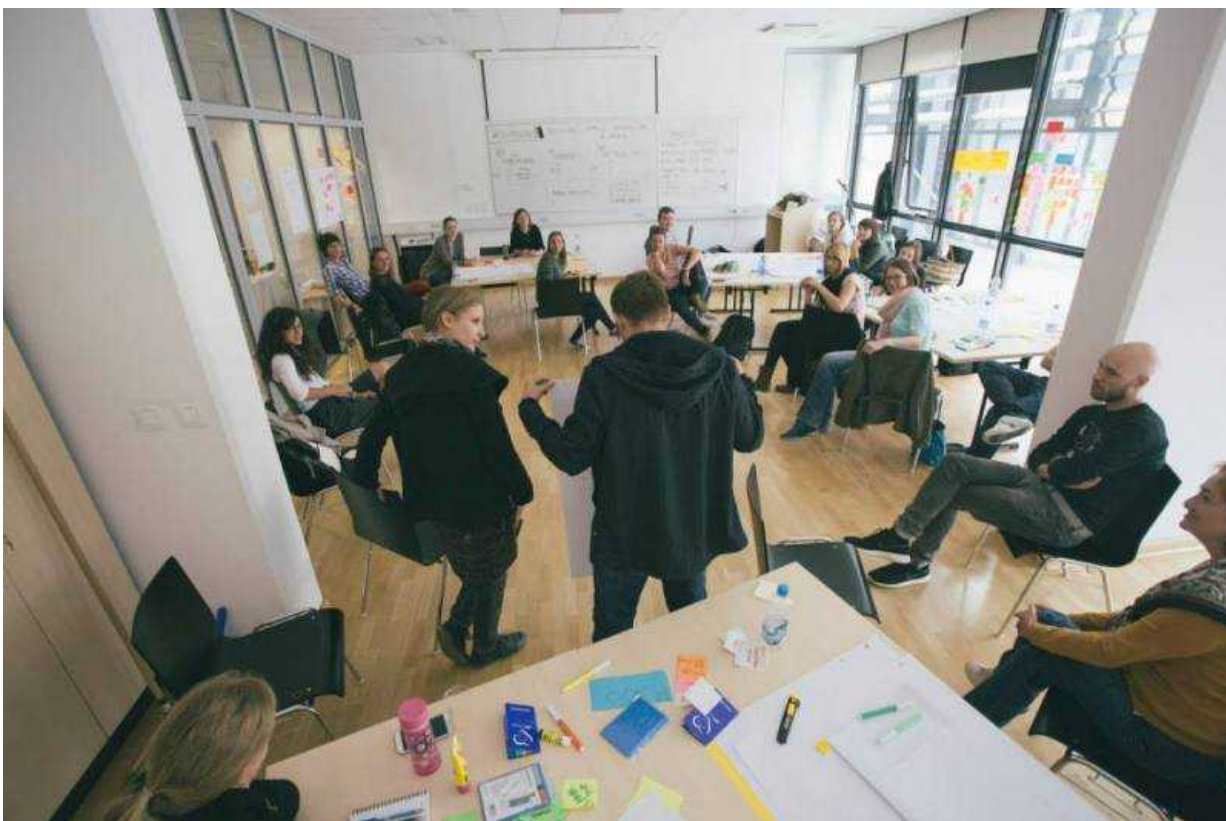
SIXPO 2.0 – podjetništvo z družbenimi učinki

Tridnevni interaktivni dogodek je ponujal pisan nabor delavnic, predavanj in predstavitev s področij začasne rabe prostora, 3D modeliranja, razvijanja poslovnih modelov, socialnega podjetništva, crowdfundinga, ipd. SIXPO je mladim omogočil prostor, kjer so lahko prevetrili svoje ideje, razpravljali o ovirah, raziskali svoj potencial in razširili svojo varnostno mrežo. V treh dneh se je srečalo 250 somišljenikov!