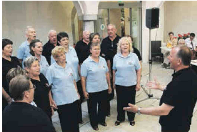
Na prireditvi To smo mi so nastopili tudi pevci Društva upokojencev iz Straže.