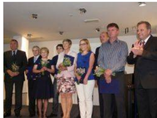
Prejemniki priznanja občine Trebnje