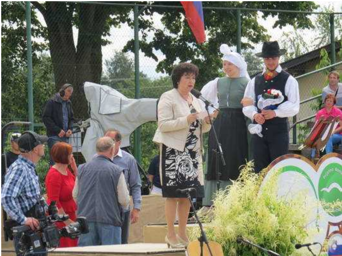
Zbrane je nagovorila ministrica za kulturo Julijana Bizjak Mlakar.

Po njenem prepričanju je zborovsko petje zelo priljubljeno, saj začnemo Slovenci prepevati že v rosnih mladosti. Znan je rek, po katerem trije Slovenci že tvorijo pevski zbor. »Spoštovanje lastne kulture, materinega jezika in ponos na svoje korenine je osnova za skladen civilizacijski in kulturni razvoj Slovenije v mednarodni skupnosti, ki je s pravnimi akti zavezana k spoštovanju kulturne raznolikosti. Razumevanje in spoštovanje lastne kulture je temelj za spoštovanje drugih kultur,« je prepričana Bizjak Mlakarjeva.