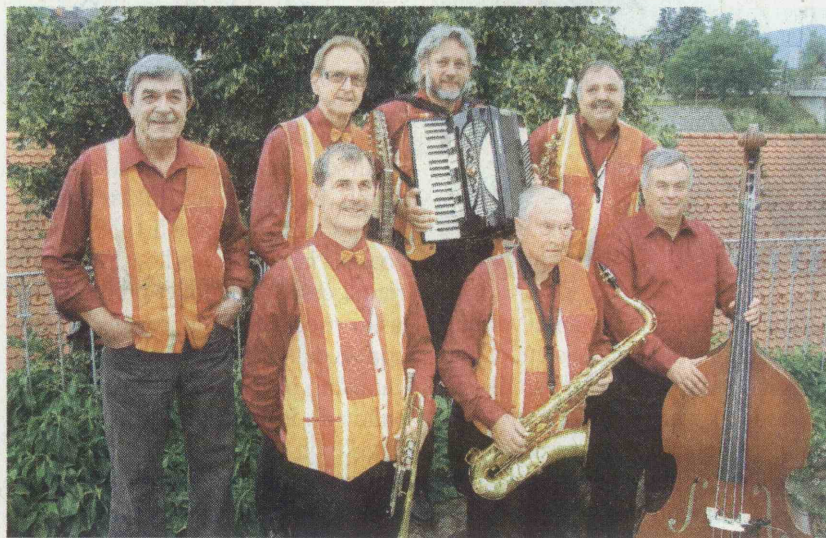
Da so se izognili dežju, so se člani ansambla Janko in prijatelji predstavili v cerkvi Svetega duha.