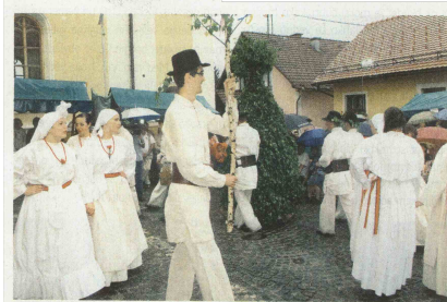
Podoknica je bila uvod v širše praznovanje Jurjevanja.