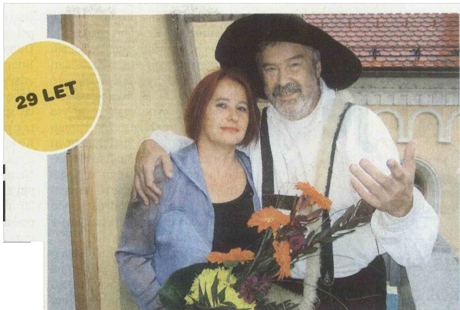
Rdečelaska in sivolasec sta ustvarjena drug za drugega.