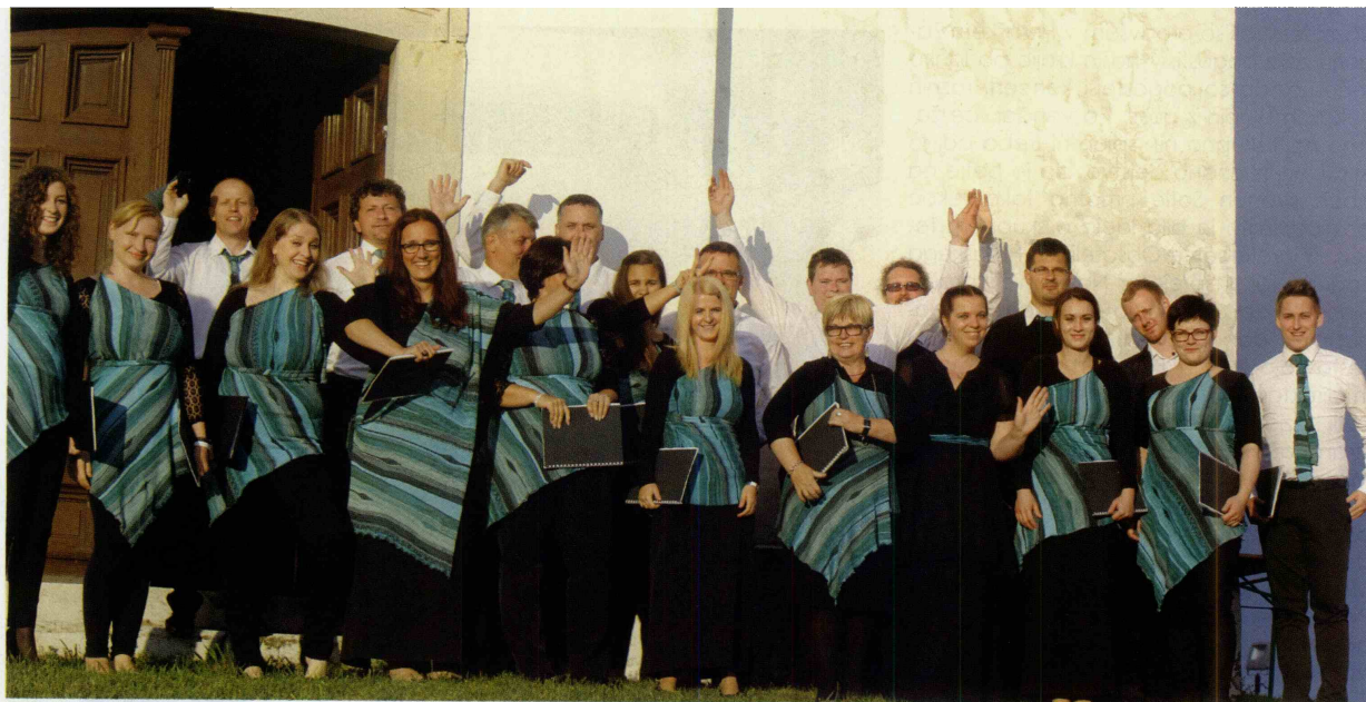
Z letošnjim letnim koncertom je MePZ Bistrica ob Sotli obeležil svojih 34 let delovanja. Pred koncertom pri se je sedanja zasedba pevk in pevcev fotografirala pred cerkvijo sv. Križa.