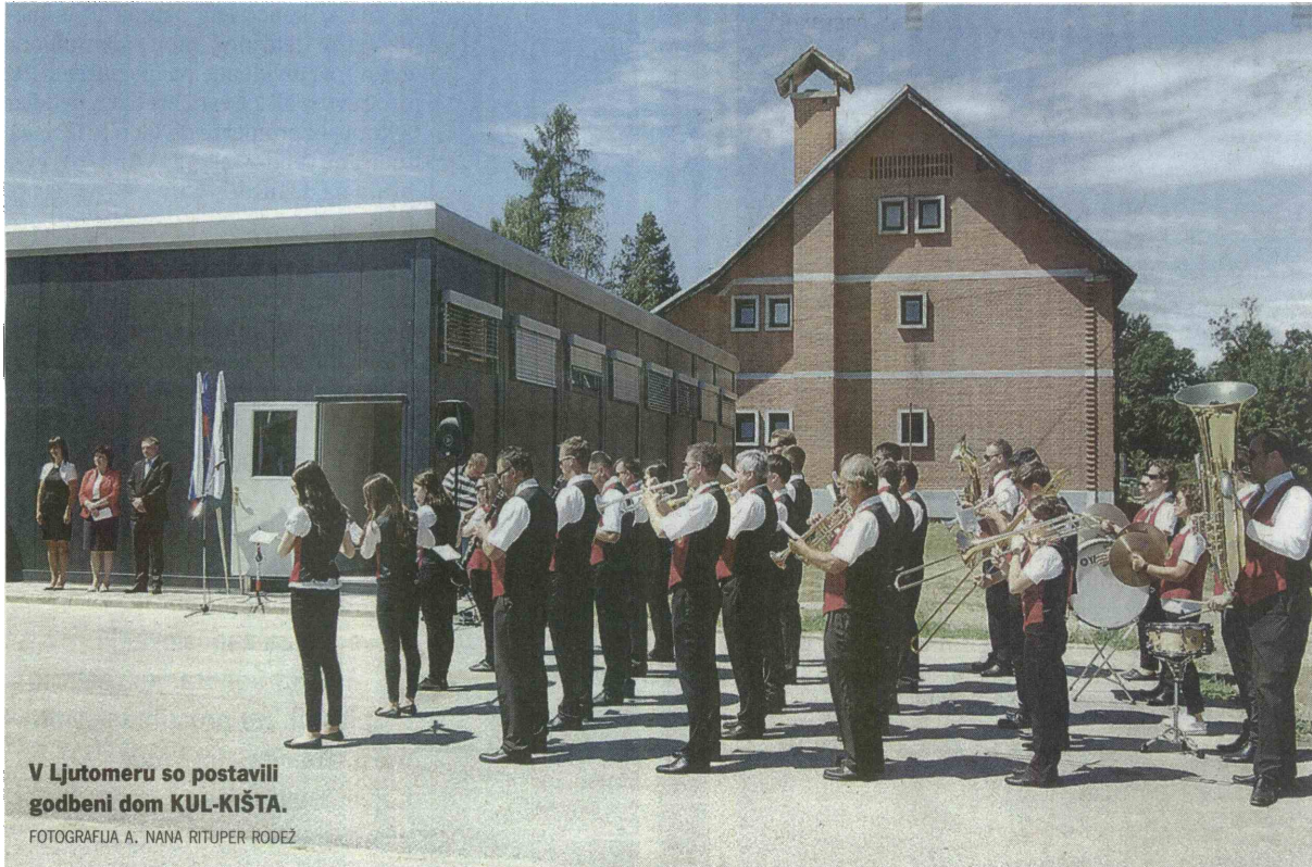
V Ljutomeru so postavili godbeni dom KUL-KIŠTA.