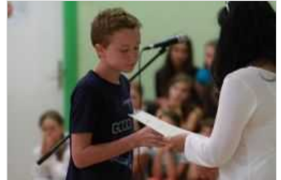
Najuspešnejši učenci so prejeli tudi priznanja in knjižne nagrade.

Besedilo: R. N., osnovna šola Dolenjske Toplice