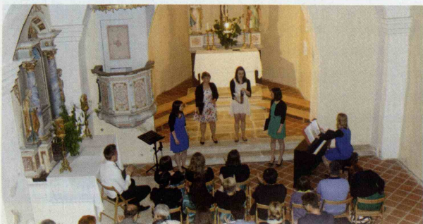
Koncert so popestrile Rusalke, štiričlanski vokalni kvartet s Koroške.