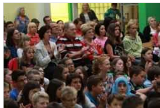
V Topličkovo učno pot so bili vključeni vsi na šoli.

V samo postavitve in izdelavo učne poti so bili vključeni učenci od prvega do devetega razreda in vsi zaposleni na šoli, k uresničitvi projekta pa so veliko pripomogli tudi različni donatorji. »Učna