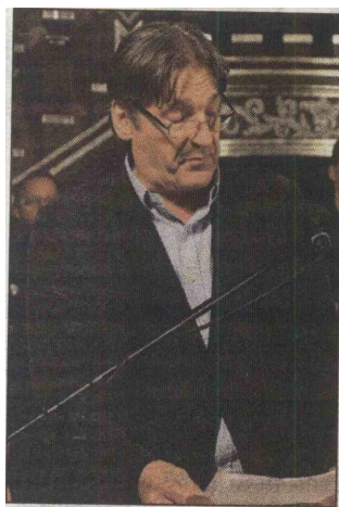
Prof. dr. Vasko Simoniti