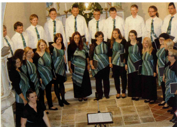
MePZ Bistrica ob Sotli je na letnem koncertu izvedel koncertne maše Missa Festiva . Bistriški zbor je sploh prvi zbor v Sloveniji, ki sploh prvi zbor v Sloveniji, ki se je lotil izvesti koncertno mašo v celoti. Za svoj projekt so pridobili podporo Javnega sklada republike Slovenije za kulturne dejavnosti.