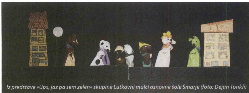
Iz predstave »Ups, jaz pa sem zelen« skupine Lutkovni mulci osnovne šole Šmarje

je bil nad videnim zelo navdušen. Tovrstna srečanja dokazujejo neurtudno delo mentorjev in otrok, ki so še vedno polni idej. Nemalokrat sodelujejo v celotnem postopku nastajanja predstave, saj lutke pogosto sami izdelajo in nato predstavijo tudi odigrajo.