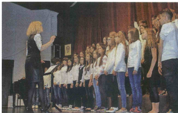
Sedemdesetčlanski mladinski zbor OŠ Koroška Bela

V kulturnem domu na Slovenskem Javorniku je potekalo srečanje otroških pevskih zborov, ki ga pripravlja Območna izpostava Javnega sklada za kulturne dejavnosti Jesenice.