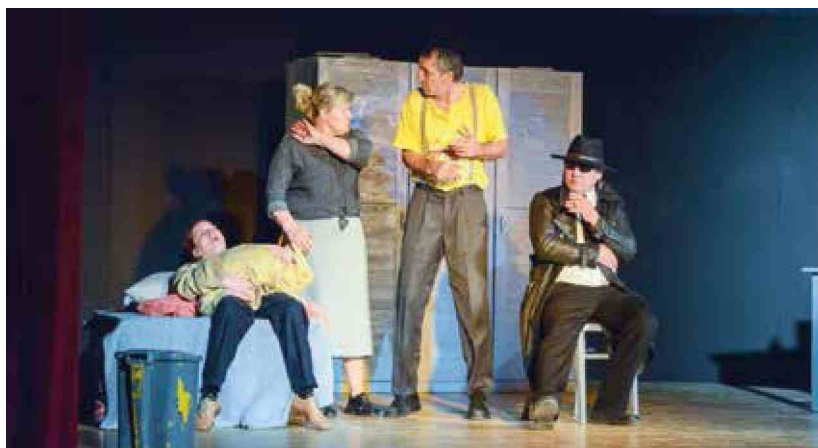
Prizor s predstave Vse zastonj , ki jo je Koroški deželni teater igral na letošnjem območnem Linhartovem srečanju v Slovenj Gradcu.

V Slovenj Gradcu in Starem trgu so nastopile štiri od napovedanih petih ljubiteljskih gledaliških skupin. Regijsko Linhartovo srečanje bo maja na Ravnah na Koroškem.