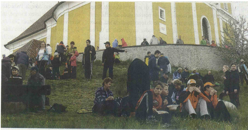
Gora Oljka je bila letos precej manj obljudena kot na minulih prvomajskih srečanjih.