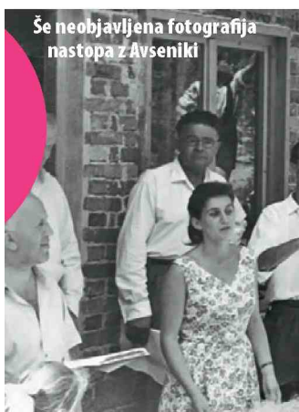
Še neobjavljena fotografija nastopa z Avseniki