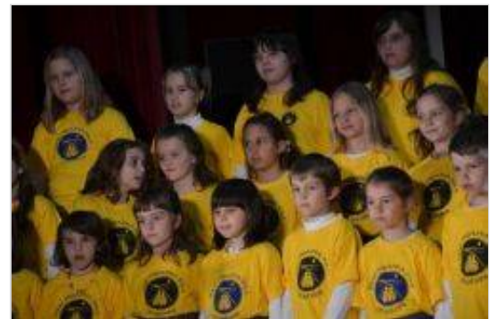
ilustrativna slika

»Vse dogodke bo spremljala Potujoča razstava TLK – kolaž fotografij z