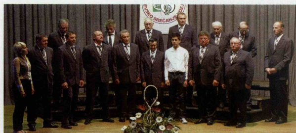
Zasluge za to, da so v Kozjem pevski srečanja za pevce in vse, ki imajo radi pesem, tako ljudsko kot umetno, postala tradicija, si lastijo predvsem člani Moškega pevskega zbora Kozje, ki vsako leto skrbijo za pevsko in prijateljsko druženje kozjanskih pevskih zborov in skupin.

srečanje, s katerim bi zbori pokazali kakovost svojega ustvarjanja in napredka, temveč se je dolga tradicija srečanj ohranila predvsem zahvaljujoč dejstvu, da so ta srečanja vselej v prvi vrsti prijateljsko druženje, ko se poje z dušo in iz srca. (Mojca Valenčak)