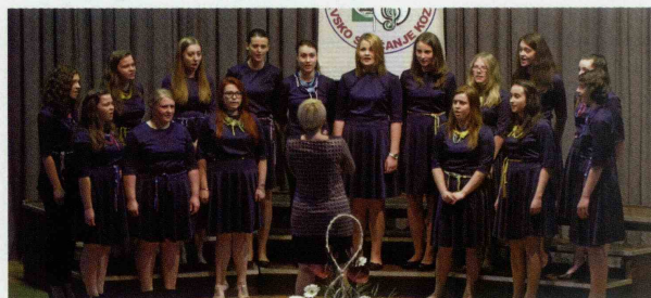
Pevke Dekliškega cerkvenega zbora La vita zase pravijo, da jih družijo ljubezen do petja, druženje na pevskih vajah in prepevanje pri nedeljskih mašah, sodelujejo pa tudi na prireditvah ob kulturnih in krajevnih praznikih, na pevskih revijah in srečanjih.