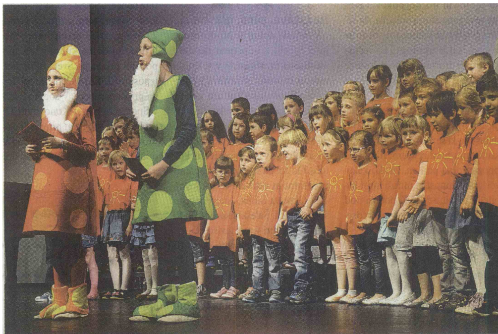
Malčki v vrtcih radi pojejo. Toliko jih je, da so v torek popoldne peli kar na treh koncertih, da so jim lahko prisluhnilo vsaj starši. Kot vedno so navdušili s prisrčnostjo, pa tudi petjem.

Območne pevske revije bo sklad končal to soboto z območno revijo malih vokalnih skupin Šaleške doline. Letos jo prvič pripravljajo samostojno, saj so sicer manjši vokalni sestavi nastopili v sklopu revije odraslih pevskih sestavov. Revijo so poimenovali Pesem pod arkadami, saj bo na Velenjskem gradu. Začela se bo ob 19. uri, pripravljajo pa