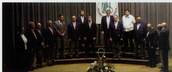
MoPZ »Terme Olimia« iz Podčetrčka letos praznuje častitljivi jubilej, 40. obletnico delovanja zbora, kar bodo obeležili s slavnostnim koncertom, ki bo 24. oktobra letos v Podčetrčku.