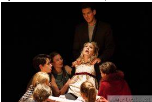
Prizor iz predstave Jaz ali kdo drug.