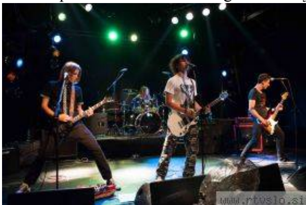
Nagrado za avtorski pristop je prejela skupina Ice on fire iz Novega mesta.