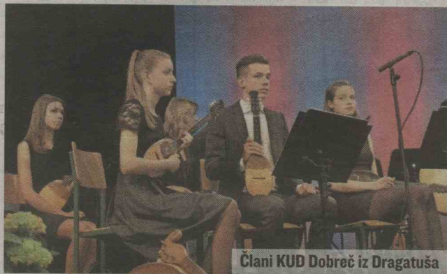
Člani KUD Dobreč iz Dragatuša