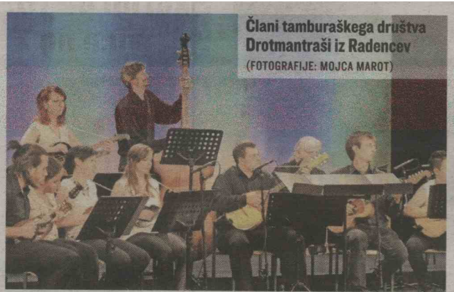
Člani tamburaškega društva Drotmantraši iz Radencev