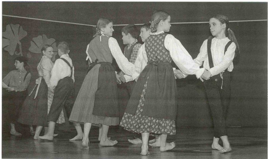
Obiskovalcem je zaplesalo, zapelo in zagodlo več kot dvesto nastopajočih.