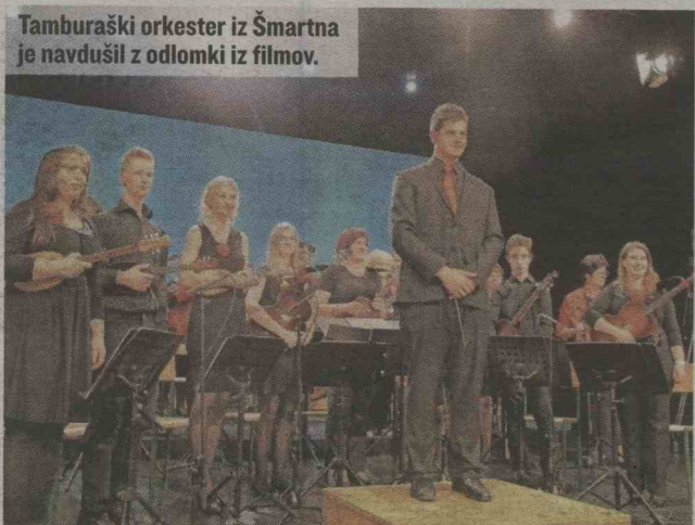
Tamburaški orkester iz Šmartna je navdušil z odlomki iz filmov.