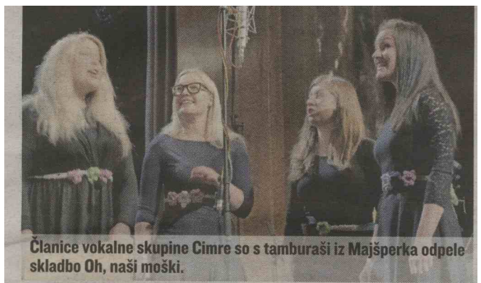
Članice vokalne skupine Cimre so s tamburaši iz Majšperka odpele skladbo Oh, naši moški.

Objave so namenjene interni uporabi v skladu z odločbami ZASP in se brez soglasja imetnika pravic ne smejo prosbo razmnoževati in distribuirati!