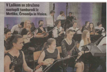
V Laškem so združeno nastopili tamburaši iz Metlike, Črnomlja in Vinice.