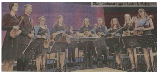
Člani tamburaškega orkestra iz Majšperka