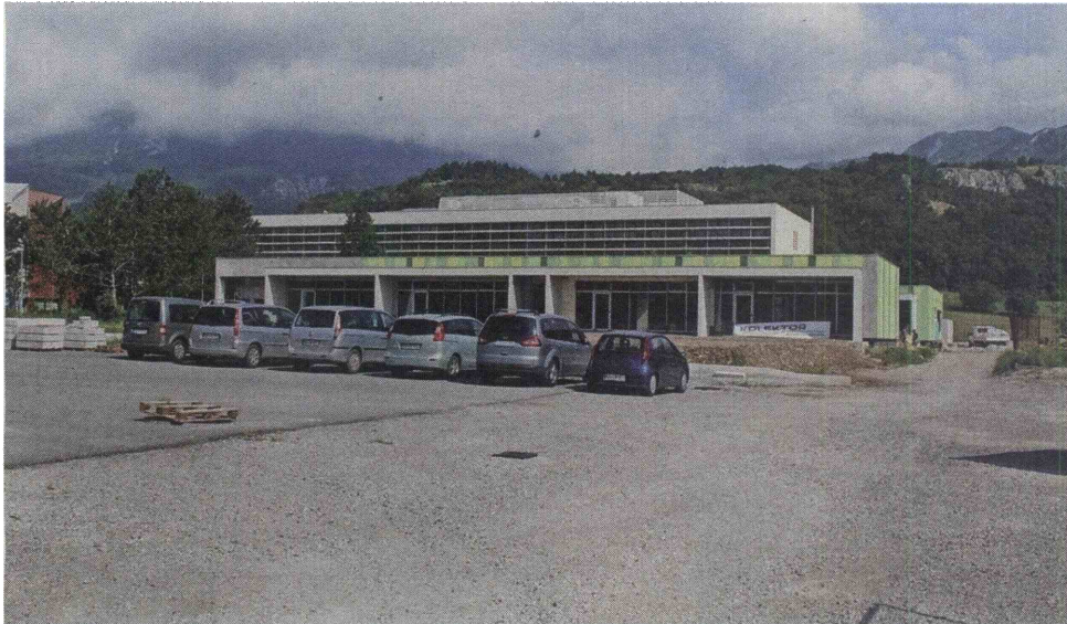
Kolektor Koling v novi stavbi končuje prvotno načrtovana dela, občina pa izdeluje načrte za dodatne učilnice.