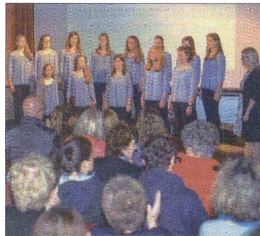
Utrinek s koncerta na Proseku