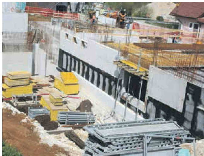
Na gradbišču bo kmalu vidna podoba novega šolskega objekta s telovadnico.