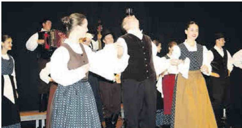
Folklorniki zmorejo poskočne korake in natančne gibe, pri katerih polna časa ostane ves čas na čelu.