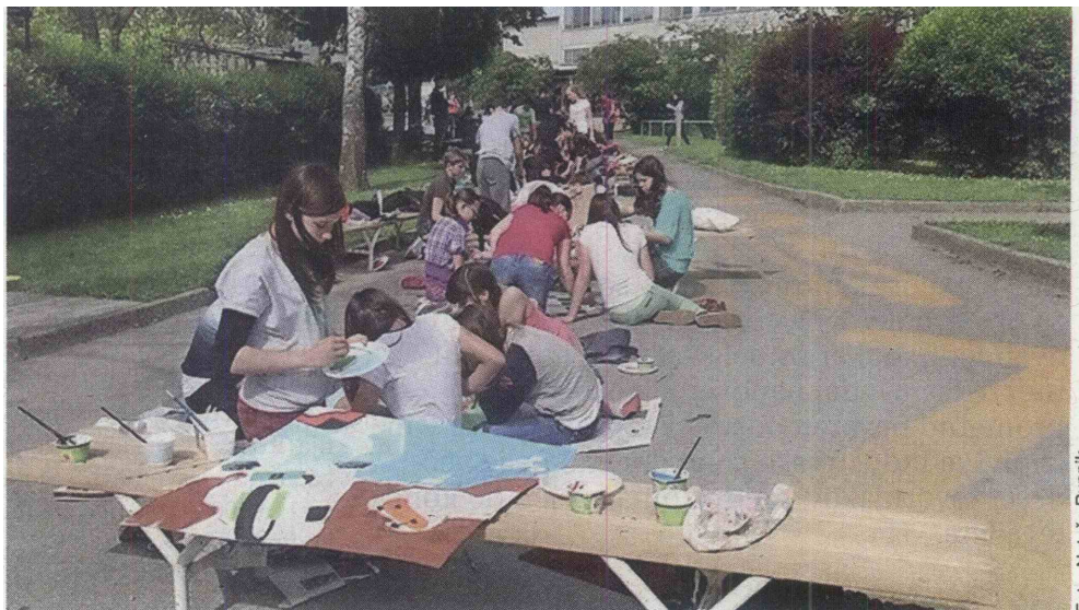
OŠ Danila Lokarja je že v drugo postala naj kulturna šola med velikimi šolami. Pohvali se s številnimi kulturnimi dejavnostmi, projekti in prireditvami.