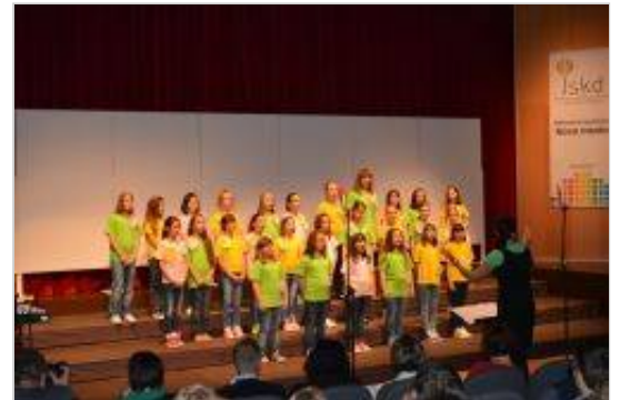
Združeni otroški zbor OŠ Dobova in PŠ Kapele je osvojil zlato priznanje.