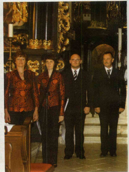
Vokalna skupina Freya.