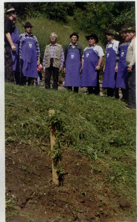
Pilštanjski gospodarji so na novo posajeni drnuli zapeli za boljšo rast.