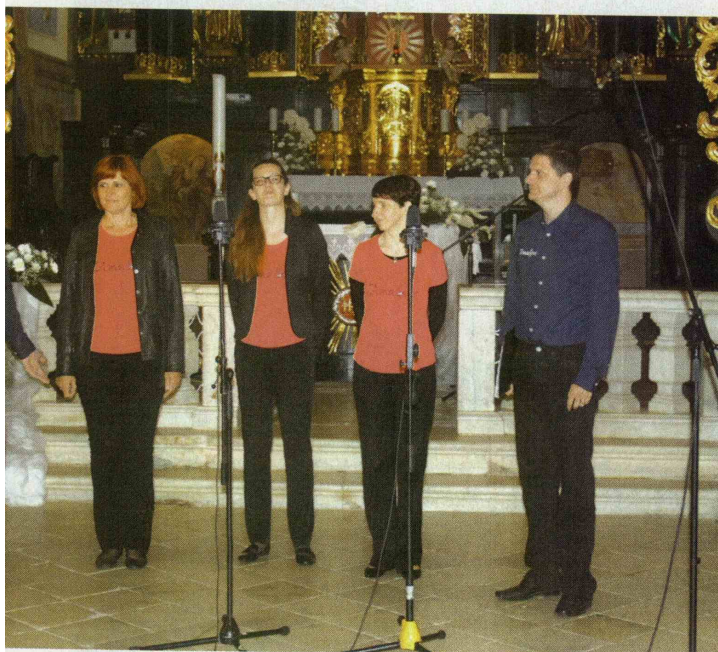
Komorna vokalna skupina Amadeus.