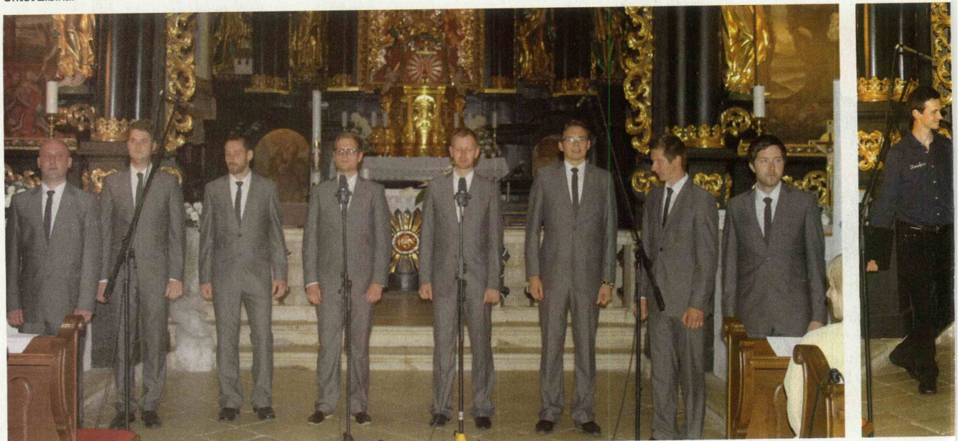
Vokalna skupina Osti jarej.