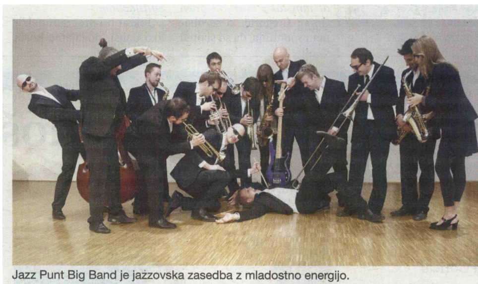
Jazz Punt Big Band je jazzovska zasedba z mladostno energijo.

To poletje lahko Jazz Punt Big Bandu prisluhnete na Primorskem še 30. junija v Novi Gorici na mednarodnem srečanju saksofonistov, 2. julija v Idriji, dan kasneje v Sežani (Mladifest), 4. julija v Marezigah ( festival Marezijazz ) in 11. julija v Breginju.