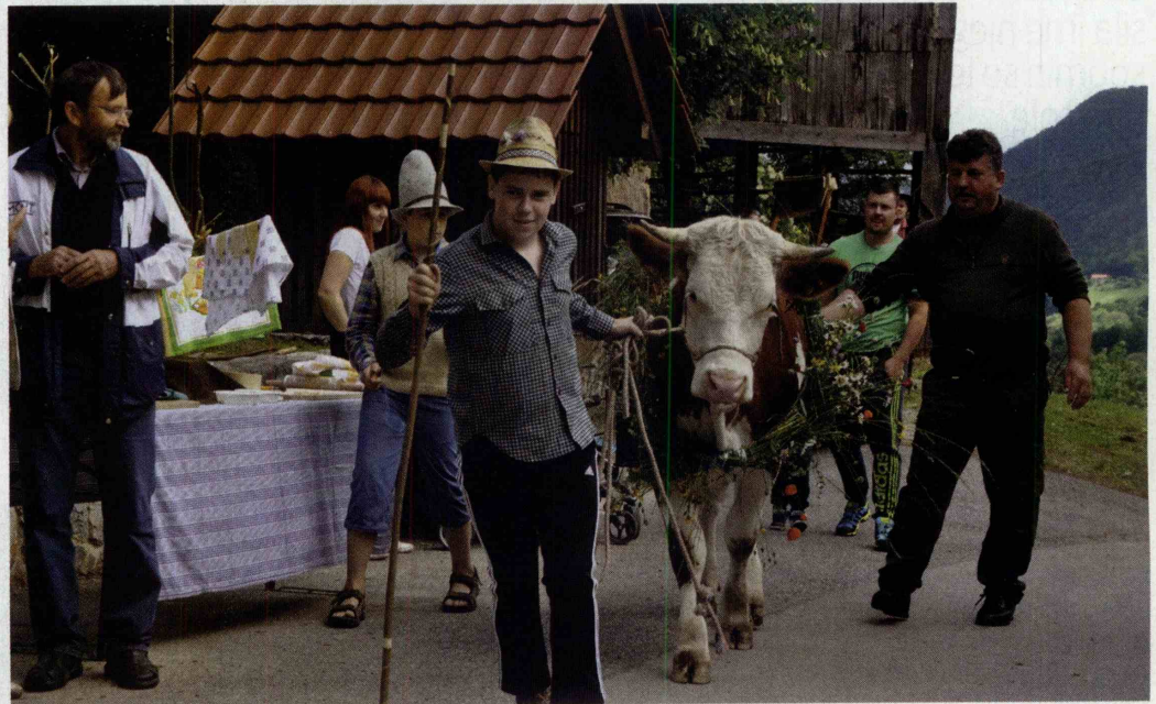
Je pri pripeljal kravo na pašo in postal pastirski „kenig“.

V sklopu prireditve je v starodavnem trgu potekala tržnica z izdelki s kmetij in vinogradov, predstavila se je osnovna šola Lesično. Kot posebnost so letos prvič pripravili izmenjavo avtohtonih