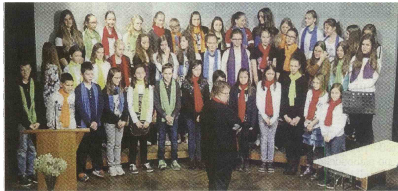
Mladinski pevski zbor OS Rodica