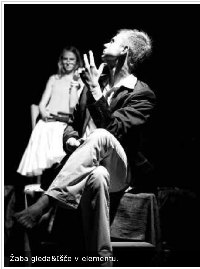
Žaba gleda&Išče v elementu.

Kot največji dosežek skupine so izpostavili to, da so se z vaškega odra že dvakrat uvrstili v finale festivala Vizija, pa tudi to, da so že toliko let skupaj ter da jim še ni zmanjkalo volje in idej.