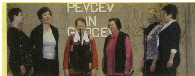
Ljudske pevke KUD Andreja Stefanciosa Studenice (domačinke).

Tokratno območno srečanje je bilo že 17. zapored. Vsako drugo leto (bionalno) poteka še regijsko srečanje, na katerem strokovna spremljevalka na podlagi slušnih posnetkov izbere najboljše skupine, katere se nato neposredno uvrstijo kar na državno srečanje. (B. P.)