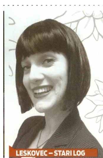
LESKOVEC – STARI LOG

Boleča resnica se razkriva skozi komične zaplete.