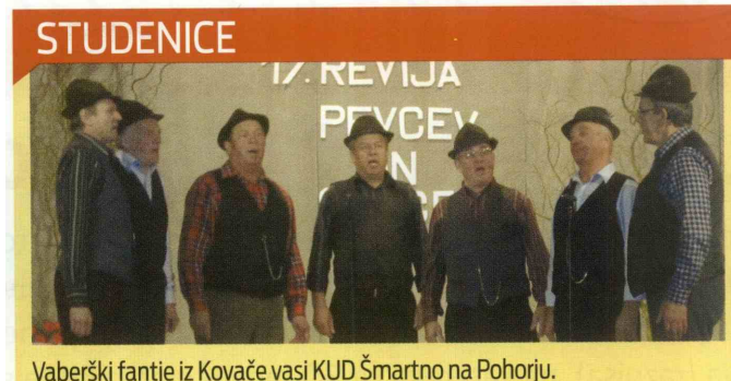
Vaberški fantje iz Kovače vasi KUD Šmartno na Pohorju.