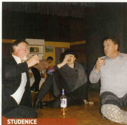
Na tleh je takrat, ko ni elektrike, še najbolj varno.