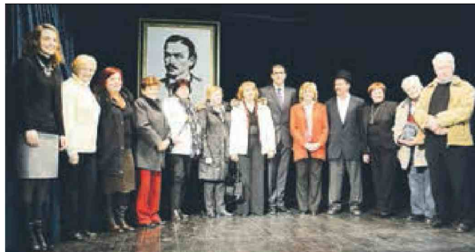
V kulturnem domu na Muljavi so podelili Jurčičeve plakete s področja ljubiteljske kulture.