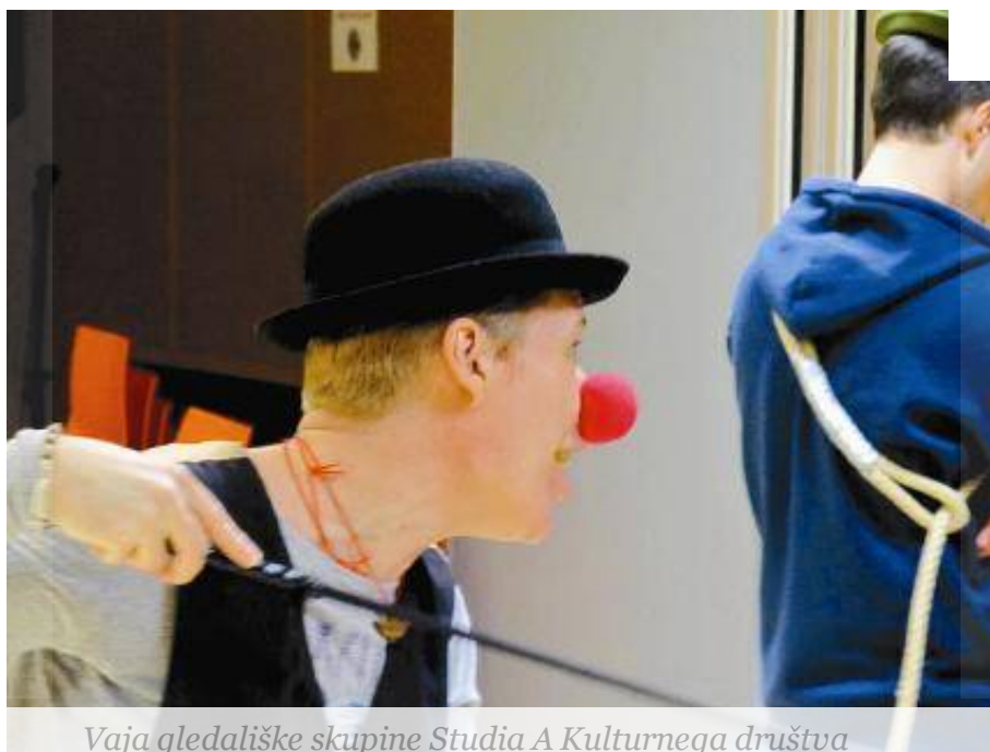
Vaja gledališke skupine Studia A Kulturnega društva

1 od 1 Slovenj Gradec, igrajo Čakajoč Godota