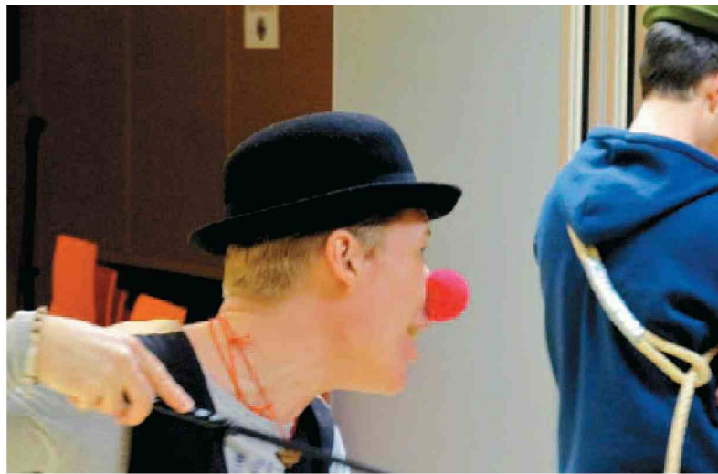
Vaja gledališke skupine Studia A Kulturnega društva Slovenj Gradec, igrajo Čakajoč Godota (Arhiv društva)

V Slovenj Gradcu bo na območnem srečanju pet predstav; tudi 5XNE gledališke skupine SPUNK Gimnazije Slovenj Gradec, ki bo v okviru Anderličevih dnevov in srečanja mladinskih skupin Vizije nastopila že v petek, 20. marca, ob 16. in 20. uri v kulturnem domu Stari trg. Na istem odru se bo v petek, 27. marca, ob 19. uri predstavila ljubiteljska gledališka skupina KD Šmiklavž, ki deluje že vse od leta 1957 in vsako leto za naslednjo zimsko sezono naštudira po eno gledališko igro. Večina so to dela domačih, slovenskih avtorjev, nekaj del pa ima skupina tudi avtorskih. Za zimsko sezono 2014/15 so pripravili gledališko igro Gospa po-