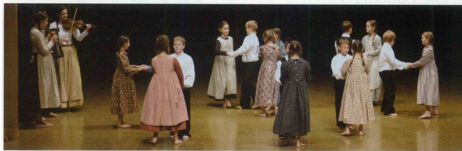
Otroška folklorna skupina Uršula 1 Rogatec.