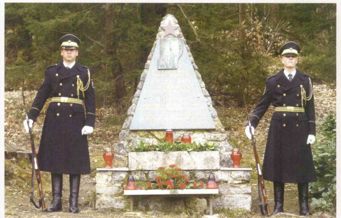
Predstavnika Slovenske vojske ob spomeniku

Učenci Osnovne šole Franja Malgaja Šentjur so pripravili kulturni program. Zaigrali so na flauto, violino in citrali pesmi Cirila Zlobca. Za konec uradnega dela pa je Moški pevski zbor skladatelj Ipvavcev Šentjur zapel še Pesem XIV. divizije. (K.B.)