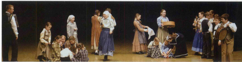
VIZ II. OŠ Rogaška Slatina, POŠ Kostrivnica, OFS »Vrelčki«.