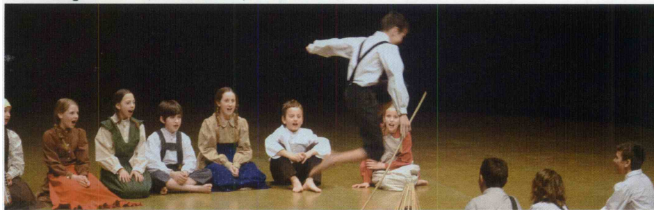
VIZ I. osnovna šola Rogaška Slatina.