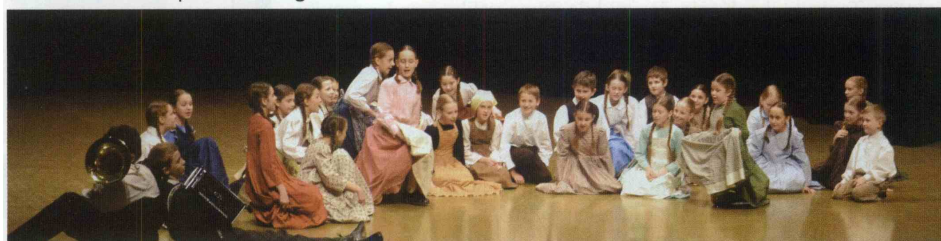
KD Spominčice VIZ II. OŠ Rogaška Slatina.