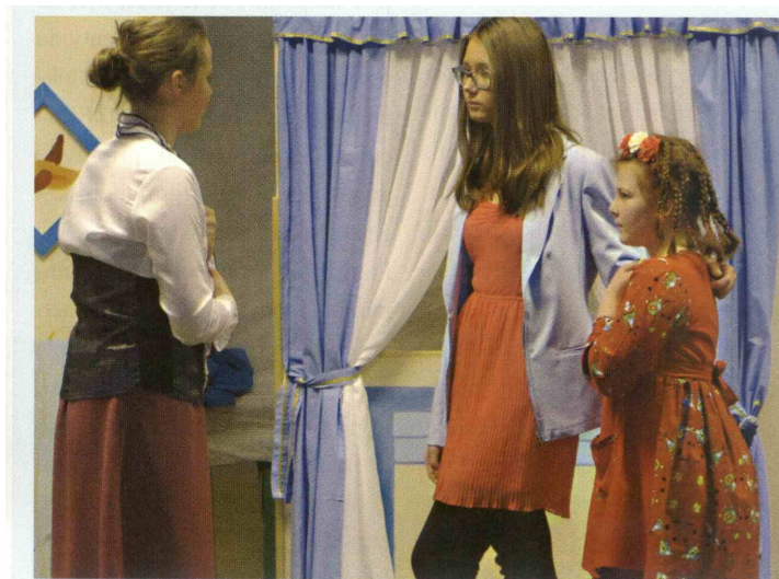
Drameljski učenci so zaigrali v predstavi Heidi.