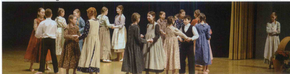
Otroška folklorna skupina Uršula Rogatec.