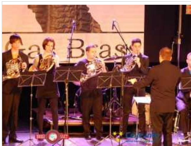
Skupina Nova Brass