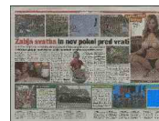
Fešta band iz Velenja