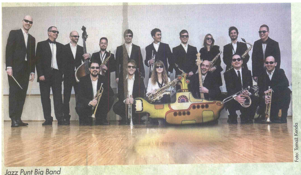
Jazz Punt Big Band

“Do danes smo imeli skoraj sto koncertov doma in v tujini