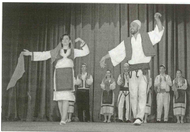
Plesalci KD Iliria iz Kopra so se predstavili z albanskimi plesi.

ja v slovenski Istri, in sicer z odrski ma postavitvama Šota in Tropojanski ples. Utrip Makedonije so obiskovalcem pričarali člani Makedonskega kulturnega društva Sv. Ciril in Metod iz Kranja, ki preko narodnih plesov prikazujejo makedonske šege ter navade. Utrip Srbije je prineslo Kulturno umetniško društvo Mladost iz Ljubljane. S folklornimi skupinami redno nastopajo na različnih prireditvah.