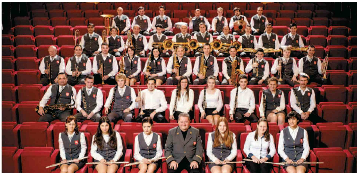
V Ormožu bodo gostili tudi KD Godba na pihala Slovenske Konjice.

Javni sklad RS za kulturne dejavnosti (JSKD) v sodelovanju z ormoškima glasbeno šolo in občino pripravlja jubilejno, 20. tekmovanje godb Slovenije v zabavnem programu za pokal Vinka Štrucla. "Tekmovanje spodbuja kakovostno izvajanje programov zabavne glasbe. Letošnje bo to soboto, 7. novembra, v Martinovem šotoru. Začeli bomo s skupnim dopoldanskim nastopom vseh devetih godb na Kerenčičevem trgu in nadaljevali