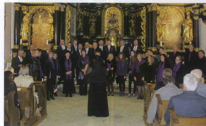
Zadnjo pesem so odpeli skupaj gosti, pevci Zvona.