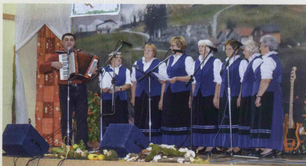
Ljudske pevke so k sodelovanju ponovno povabile župana Petra Misjo, ki je z njimi z veseljem zapel in zaigral.