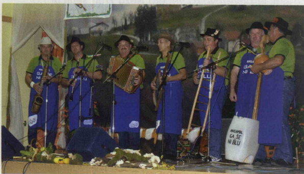
Predstavil se je tudi ansambel Ga še ni blu.