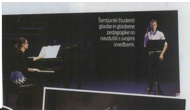
Šentjurski študenti glasbe in glasbene pedagogike so navdušili s svojimi izvedbami.