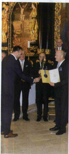
Častne Gallusove značke se podeljuje zelo redko, tokrat so podelili kar štiri.