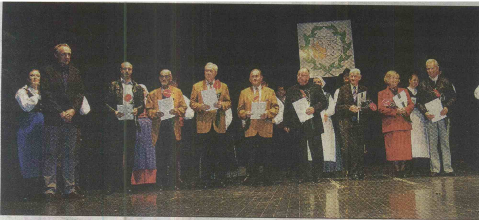
Prejemniki društvenih plaket

SENOVO – Delavsko kulturno društvo Svoboda Senovo je 24. oktobra v domačem Domu XIV. divizije obeležilo 70-letnico delovanja. Program so oblikovale vse štiri delujoče sekcije - pihalni orkester, dramska, folklorna in lutkovna sekcija, podelili pa so tudi društvene plakete.