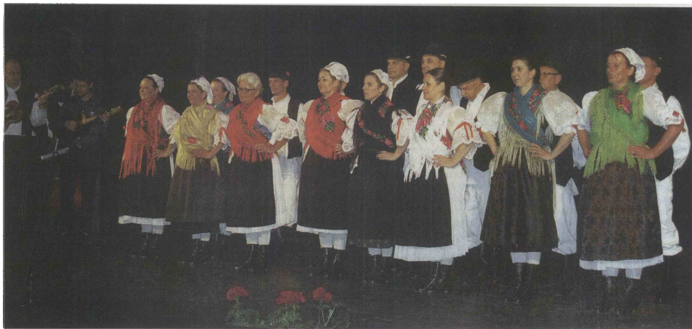
Folklorna skupina Hrvaškega kulturnega društva Pomurje ob nastupu v lendavski gledališki in koncertni dvorani