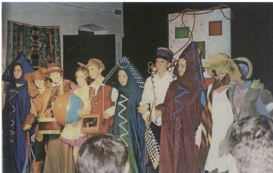
Prva predstava, Žogica Nogica, sezona 2000/2001