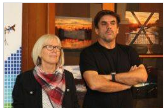
Izbor fotografij za razstavo sta naredila Tanja Plevnik in Arne Hodalič.