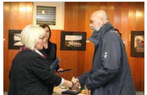
Po številu razstavljenih in nagrajenih del je izstopal fotograf Vlado Bucalo.